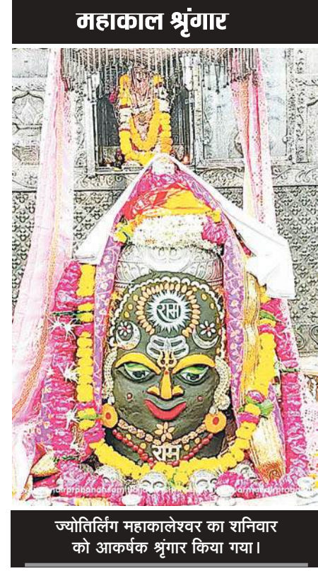
ज्योतिर्लिंग महाकालेश्वर का शनिवार को आकर्षक श्रृंगार किया गया।