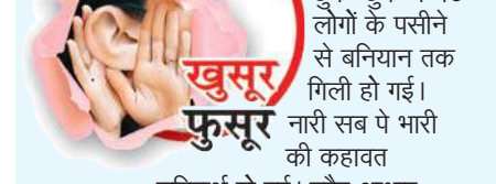
गर्मी के दिन और रात के समय छुक-छुक में बैठे लोगों के पसीने से बनियान तक गिली हो गई। नारी सब पे भारी की कहावत चरितार्थ हो गई। बैंगर आधार, गवाह, सबूत के सब कुछ कर दिया। बेचारे गरीबों की जेब पर तरस भी नहीं आया।

अजीब तरह की कार्रवाई देखी और सूनी गई। मजदूरी कर जीवन ज्ञापन करने वालों के पास जेब में वैसे ही गिनती के पैसे रहते हैं उनमें से भी बेवजह जांच के नाम पर खर्च करवा दिए गए। सफर में सहयोग करना तो दूर की बात और समस्या के साथ संकट पैदाकर दिया और पैदा भी उसने किया जिसके पास गरीबों को पूरी मजदूरी मिले इस बात का ध्यान रखने की जिम्मेदारी है। खास तो यह रहा कि श्रम भी ऐसा किया गया कि बैंगर आधार के ही पूरी छुक-छुक रूकवा दी गई।