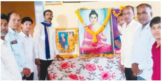
बिरसा अंबेडकर फूले समाज कल्याण समिति द्वारा मनाया