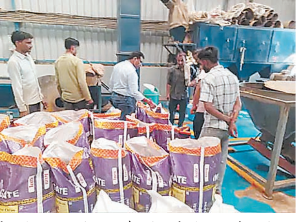
से हल्दी पाउडर, मिर्च पाउडर और राई दाल के तीन नमूने जांच के लिए लिए गए। सभी नमूनों को विस्तृत परीक्षण के लिए लेब भेजा जा रहा है। कार्रवाई के दौरान एच.के. फूड में मिर्च पाउडर और नूडल्स मसाला के सैंपल लिए गए। निरीक्षण में खाद्य सामग्री संदिग्ध प्रतीत होने पर टीम ने शेष स्टॉक को सुरक्षित अभिरक्षा में ले लिया। मौके से लगभग 998

खाद्य पदार्थों में मिलावट के खिलाफ चलाए जा रहे विशेष अभियान के तहत इंदौर में संभागीय खाद्य फ्लाईंग स्क्वाड ने शनिवार को मसाला निर्माण फैक्टरियों पर कार्रवाई की है। टीम ने खंडवा रोड स्थित विभिन्न मसाला निर्माण प्रतिष्ठानों का निरीक्षण कर नमूने एकत्रित किए और संदिग्ध खाद्य सामग्री का बड़ा भंडार जब्त किया। टीम ने खंडवा रोड स्थित कैलेंड करताल क्षेत्र में संचालित राठौर ट्रेडर्स का निरीक्षण किया। यहां मिर्च पाउडर और धनिया पाउडर का निर्माण होते पाया गया। जांच के दौरान मिर्च पाउडर, धनिया पाउडर, खड़ा धनिया और धनिया दाल के कुल चार नमूने लेकर परीक्षण के लिए राज्य खाद्य परीक्षण लेब भेजे गए। इसके बाद टीम ने सौरभ स्पाइसेस प्राइवेट लिमिटेड का निरीक्षण किया। यहां