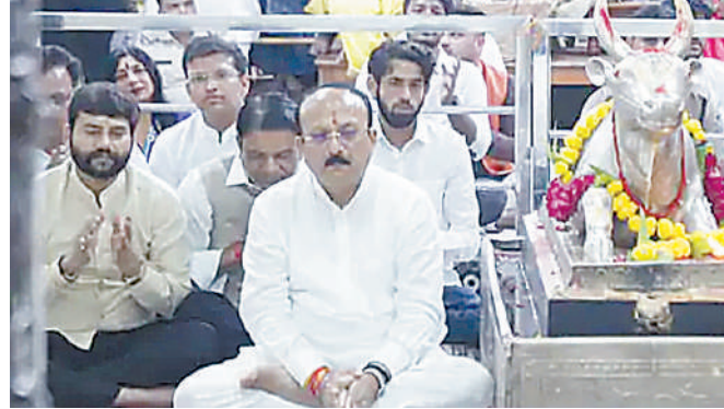
दैनिक अवन्तिका ►► उज्जैन