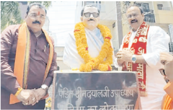
स्थल पहुंचे और वहां भी माल्यार्पण किया।