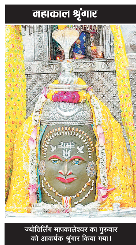
ज्योतिर्लिंग महाकालेश्वर का गुरुवार को आकर्षक श्रृंगार किया गया।