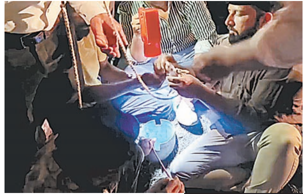
ब्रह्मास्त्र >> उज्जैन