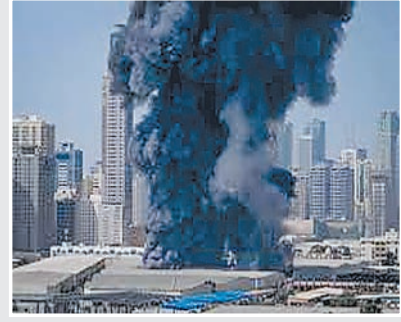
ब्रह्मास्त्र ►► मुंबई

पश्चिम एशिया संकट से उपजी वैश्विक आर्थिक अनिश्चितताओं के कारण मार्च के आंकड़ों में देश के वस्तु निर्यात में सात से आठ फीसदी की गिरावट आ सकती है। वहीं, 2025-26 में दो से तीन फीसदी की गिरावट की आशंका है। सरकार मार्च महीने के निर्यात के आंकड़े 15 अप्रैल को जारी करेगी।