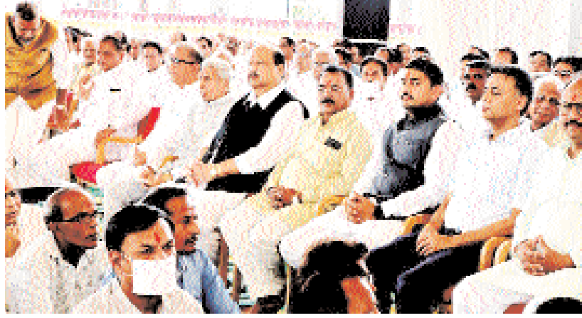
दैनिक अवन्तिका >> रतलाम