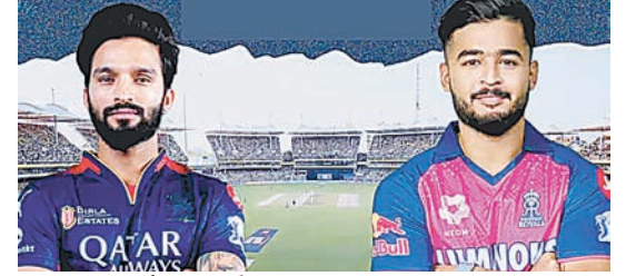
ब्रह्मास्त्र ►► जोहान्सबर्ग

आईपीएल में आज आरआर-आरसबी दोनों टीमों अब तक नहीं हारी राजस्थान टेबल में टॉप पर