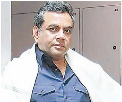
धुरंधर देखकर परेश रावल बोले