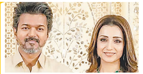
तृषा का क्रिटिक पोस्ट वायरल

इसके अलावा, वह पीरियड एक्शन ड्रामा फिल्म 'रणबाली' में अपने पति और एक्टर विजय देवरकोंडा के अपोजिट काम कर रही हैं। इस फिल्म में वह जयम्मा का किरदार निभाएंगी।