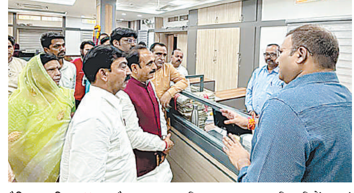
दैनिक अवन्तिका ► उज्जैन