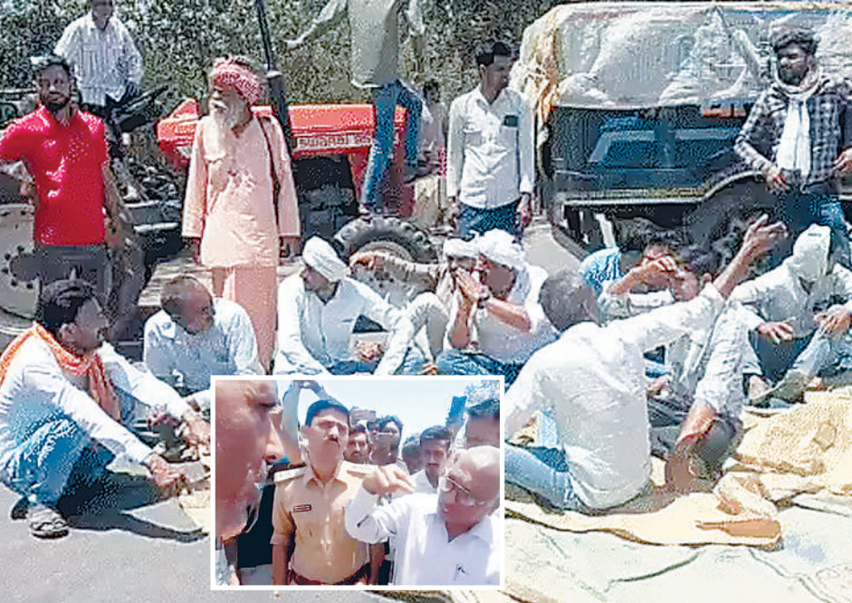
जाने वाले वाहन फंस गए। सोडंग के पास बोरखेड़ा भल्ला सोसाइटी के देपन खरीदी केन्द्र पर आक्रोशित किसानों ने नारेबाजी करते हुए अपनी ट्रैक्टर-ट्रालियां सड़क के बीच खड़ी कर दीं। सूचना मिलने पर पहुंची पुलिस ने समझाने का प्रयास किया लेकिन किसान मौके पर अधिकारियों को बुलाने पर अड़े रहे।