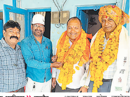
दैनिक अवन्तिका ► उज्जैन