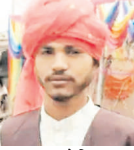
सुबह 5 बजे निकला था जानकारी में सामने आया है कि युवक बुधवार सुबह 5 बजे

थाना पुलिस मौके पर पहुंची। परिजन भी मौके पर पहुंचे शव की शिनाख्त कर बाजना सामुदायिक स्वास्थ्य केंद्र ले गए। जहां डॉक्टरों ने उसे मृत घोषित कर दिया। परिजनों के अनुसार ईश्वर मंगलवार को ग्राम देवली में नोतरे (शादी के कार्यक्रम) में गया था। देर रात तक घर नहीं लौटा। बुधवार सुबह उसकी तलाश शुरू की। तब पता चला कि वह हादसे का शिकार हो गया है।