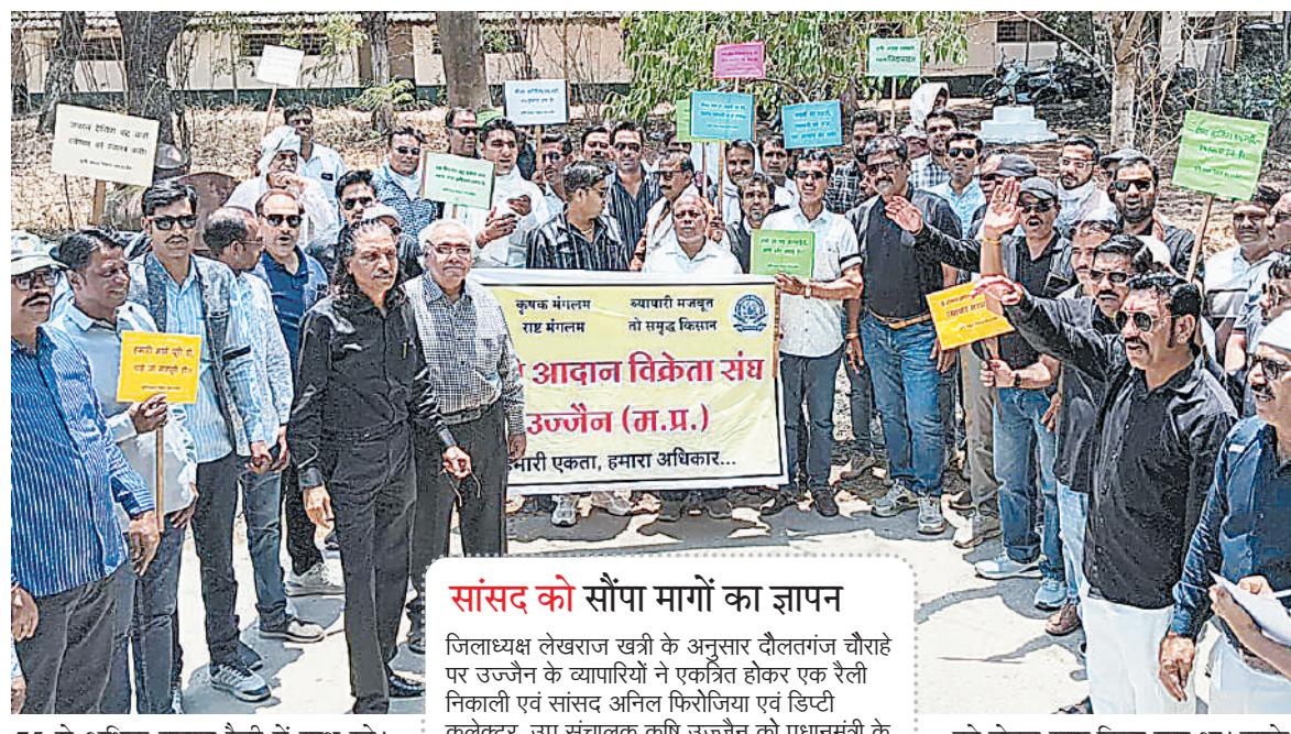
75 से अधिक सदस्य रैली में साथ रहे। रैली के दौरान जो पांच दुकानें खुली मिलीं ऐसे सदस्यों को दुकान पर जाकर सीदा प्रदान किया गया।

खाद, बीज एवं कीटनाशक व्यापारियों के राष्ट्रीय संगठन ऑल इंडिया एग्री इनपुट डीलर एसोसिएशन के आह्वान पर सोमवार को देश के समस्त खाद, बीज एवं कीटनाशक व्यापारी एक दिन के सांकेतिक हड़ताल पर रहे।