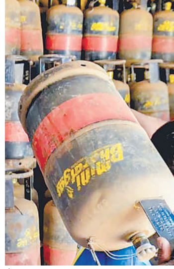
है। इसके लिए दलाल दुकानदारों के संपर्क में हैं और वे नियमों को धता बताकर टंकियों को उपलब्धता करवा रहे हैं।

गैस टंकी की कमी का असर आम उपभोक्ता पर ज्यादा असर कर रहा है। बाजार में व्यवसायिक उपयोग का काम करने वालों को यह अब दलालों के माध्यम से सुलभता से मिल रही है। यही नहीं एडजस्टमेंट वालों को भी दलाल उपलब्ध करवा रहे हैं।