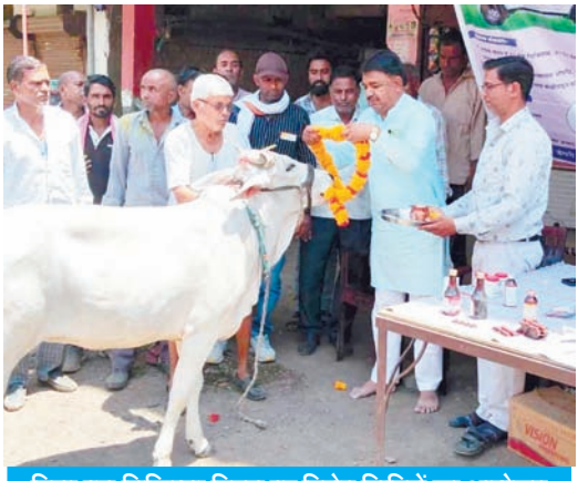
विश्व पशु चिकित्सा दिवस पर विशेष शिविरों का आयोजन