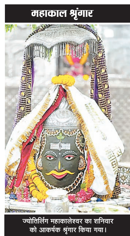
ज्योतिर्लिंग महाकालेश्वर का शनिवार को आकर्षक श्रृंगार किया गया।

झूलसाने वाली गर्मी का दौर, लू के थपेड़ों ने बेहाल किया