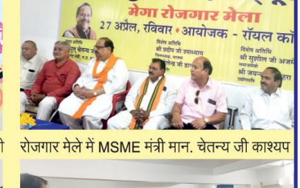
रोजगार मेले में MSME मंत्री मान. चेतन्य जी काश्यप