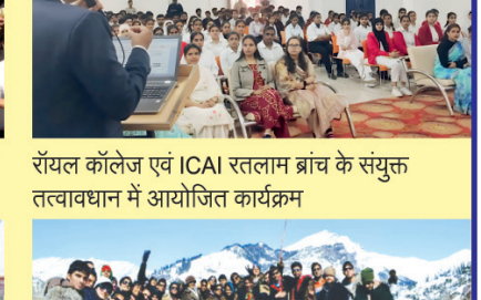
रॉयल कॉलेज एवं ICAI रतलाम ब्रांच के संयुक्त तत्वाधान में आयोजित कार्यक्रम