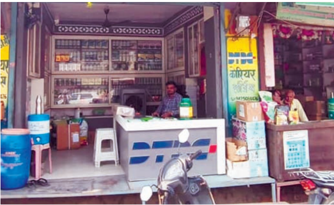
सारंगपुर में आज हड़ताल करेंगे दुकानदार।