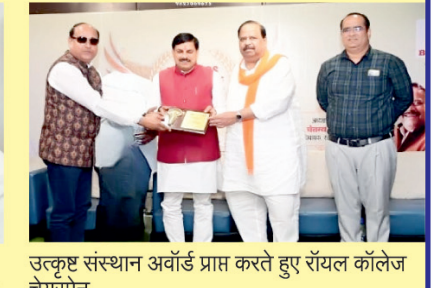
उत्कृष्ट संस्थान अवॉर्ड प्राप्त करते हुए रॉयल कॉलेज चेयरमैन