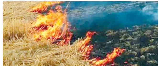
नरवाई जलाने पर हुई कार्रवाई।

नरवाई जलाने वाले किसानों पर अब सख्त कार्रवाई की तैयारी की जा रही है। तहसील मुख्यालय सहित जिलेभर में गेहूं की फसल की कटाई के बाद नरवाई जलाने से रोकने के लिए प्रशासन द्वारा रोक लगाए जाने का आदेश जारी किया गया था, लेकिन इसके बाद भी नरवाई जलाने वाले किसानों पर जुमाना और एफआईआर दर्ज कराने की कार्रवाई की जा रही है। सारंगपुर में 13 से ज्यादा गावों के किसानों आ चुके हैं। जबकि जिले में