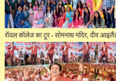
रॉयल कॉलेज का दूर - सोमनाथ मंदिर, दीव आइलैंड