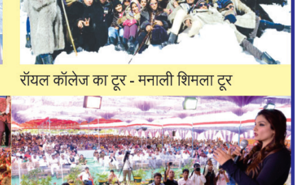
रॉयल कॉलेज वार्षिकोत्सव - बॉलीवुड अभिनेता गोविंदा, अभिनेत्री रवीना टण्डन