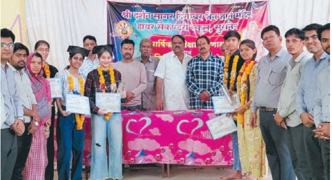
सुसनेर में प्रतिभा भावन छात्र छात्राओं को सम्मानित करते अतिथि।