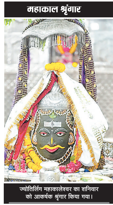
ज्योतिर्लिंग महाकालेश्वर का शनिवार को आकर्षक श्रृंगार किया गया।

झूलसाने वाली गर्मी का दौर, लू के थपेड़ों ने बेहाल किया