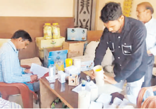
दैनिक अवन्तिका ▶▶ रतलाम