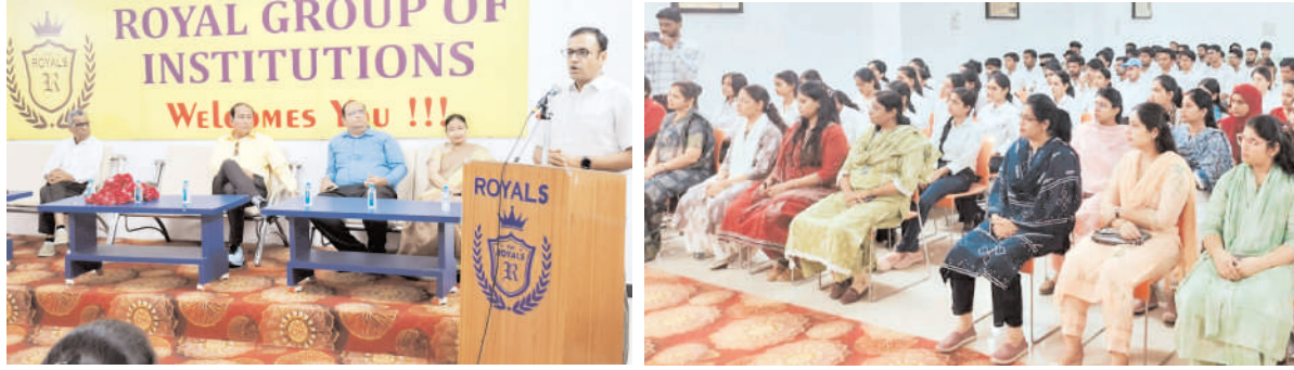
दैनिक अवन्तिका ▶▶ रतलाम