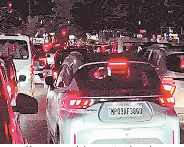
सड़कें चौड़ी हो गई हैं, लेकिन जहां एलिक्वेटेड ब्रिज का काम चल रहा है, वहां हालात उलट हैं। निरंजनपुर चौराहे पर निर्माण कार्य के चलते दोनों तरफ बैरिकेडिंग कर दी गई है, जिससे सड़क संकरी हो गई है। यहां से दोपहिया और चारपहिया वाहनों को निकलने में दिक्कत हो रही है।

दैनिक अवन्तिका ▶▶ इंदौर इंदौर में भले ही नगर निगम ने बीआरटीएस कॉरिडोर को हटा दिया हो, लेकिन शहर के कई हिस्सों में ट्रैफिक की समस्या अभी भी जस की तस बनी हुई है। खासकर जहां ब्रिज निर्माण का काम चल रहा है, वहां सड़कों के संकरे होने से लोगों को भारी परेशानी का सामना करना पड़ रहा है। ब्रिज निर्माण ने बढ़ाई परेशानी- बीआरटीएस हटने के बाद कई जगह सड़कें चौड़ी हो गई हैं, लेकिन जहां एलिक्वेटेड ब्रिज का काम चल रहा है, वहां हालात उलट हैं। निरंजनपुर चौराहे पर निर्माण कार्य के चलते दोनों तरफ बैरिकेडिंग कर दी गई है, जिससे सड़क संकरी हो गई है। यहां से दोपहिया और चारपहिया वाहनों को निकलने में दिक्कत हो रही है।