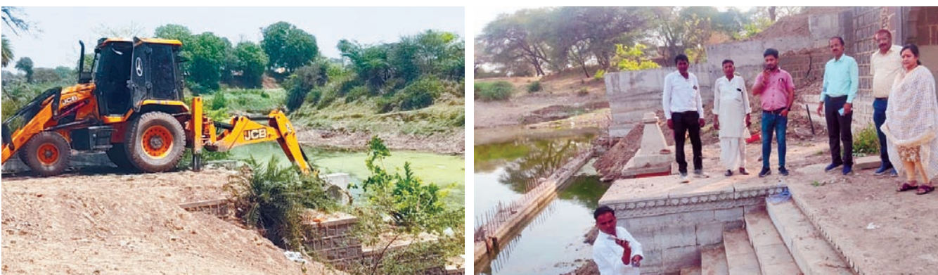
दैनिक अवन्तिका ▶▶ बड़नगर