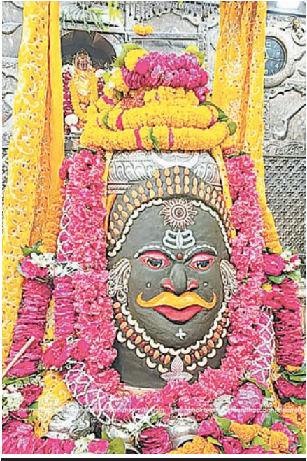
ज्योतिर्लिंग महाकालेश्वर का गुरुवार को आकर्षक श्रृंगार किया गया।