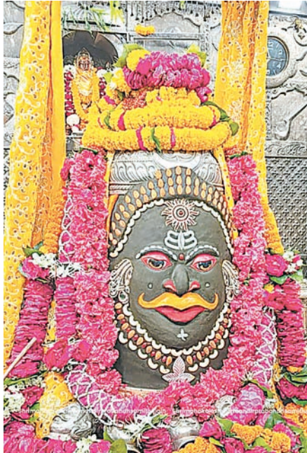
ज्योतिर्लिंग महाकालेश्वर का गुरुवार को आकर्षक श्रृंगार किया गया।