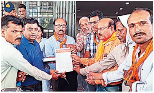
आउटसोर्स कर्मचारियों की समस्याओं को लेकर