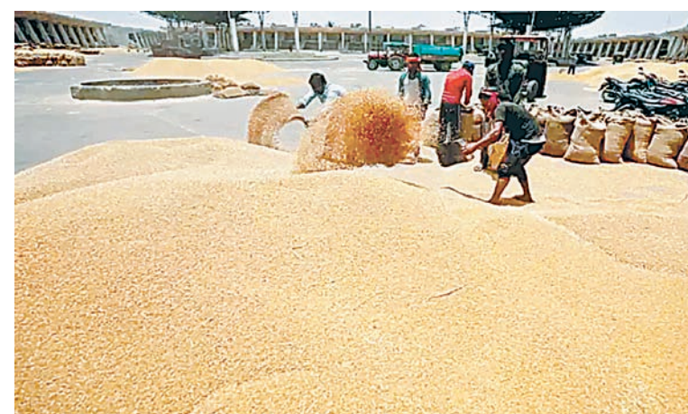
सैटेलाइट सर्वे में वे किसान उलझे हुए हैं, जिनके पास दो एकड़ से अधिक जमीन है। इस मामले में खाद्य विभाग से जानकारी ली तो पता चला कि मग्न में कलेक्टरों की जांच में करीब 45 हजार खसरे ऐसे सामने आए हैं, जिनमें कोई निर्माण हो चुका है। मंदिर है, मकान हैं या अन्य कोई शेड है। वहाँ ऐसे भी खसरे सामने आए हैं, जिनमें नदी, तालाब आ चुके हैं। ऐसे खसरों का पुनर्सत्यापन कराया जा रहा है। इसलिए सर्वे में देरी हो रही है। हालांकि पहले भी दो बार सर्वे हो चुका है। सर्वे से जुड़े पटवारियों ने बताया कि जब गिरदावरी जमा की गई थी, तब पहला सर्वे हुआ था और दूसरी बार फसल कटने पर।

दैनिक अवन्तिका ▶▶ उज्जैन समर्थन मूल्य पर गेहूँ बेचना टेढ़ी खीर साबित हो रहा है। किसान गेहूँ बेचने के लिए मंडी के बजाय तहसीलों के चक्कर लगा रहे हैं। यह वे किसान हैं, जिनके खेतों का सैटेलाइट सर्वे होना है। यह जिम्मा राजस्व विभाग का है। पटवारी, आरआई को निर्देश दिए जा चुके हैं कि वे सर्वे पूरा कर लें, लेकिन सर्वे करने में लगातार देरी की जा रही है। यदि जरा सा भी डेटा मिसमैच हो रहा है तो वह पुनर्सत्यापन में चला जाता है। सर्वे पूरा नहीं होने के कारण किसान पंजीयन के लिए जाता है तो उसका पंजीयन नहीं हो पा रहा है। किसानों ने बताया कि तहसील में जवाब दिया जाता है कि पुनरीक्षण होना है, इसलिए अटका है।