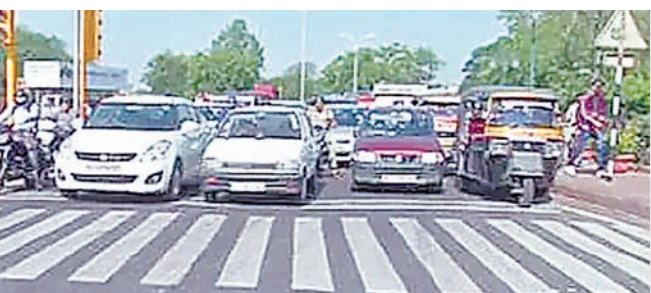
लायसेंस के लिए ये है नए प्रावधानों में

दैनिक अवन्तिका ▶▶ उज्जैन अगर आप वाहन चालन करते समय बराबर लाल बत्ती एवं झेबरा क्रॉसिंग सहित परिवहन के नियमों की अनदेखी कर रहे हैं जान बुझकर नियमों को तोड़ रहे हैं तो सतर्क हो जाएं। लायसेंस नवीनीकरण के समय आपको परेशानियों का सामना करना पड़ सकता है। उस दौरान आपके वाहन चालन का रिकॉर्ड सामने आने पर आपको शोकाज नोटिस मिल सकता है उसका जवाब देना पड़ सकता है। संबंधित अथारिटी लायसेंस निलंबित एवं निरस्त भी कर सकती है। यातायात नियमों का पालन करना आपकी और दूसरे ड्राइवर की जान बचा सकता है। दूसरी ओर, यातायात नियमों का पालन नहीं करना न केवल आपकी व अन्य किसी की जान जोखिम में डालेगा, बल्कि अब आपका ड्राइविंग लाइसेंस नवीनीकरण नहीं होने जागा। केंद्रीय परिवहन एवं राजमार्ग मंत्रालय की नई गाइडलाइन भेजी है। इसके तहत 15 साल पुरानी गाड़ी का रजिस्ट्रेशन नवीनीकरण एवं ड्राइविंग लाइसेंस नवीनीकरण करते वक्त डीकल ऑनर्स की चालान हिस्ट्री रिपोर्ट देखी जाएगी। प्रदेश में भी इसका पालन किया जा रहा है। केंद्रीय परिवहन एवं राजमार्ग मंत्रालय की नई गाइडलाइन के अनुसार ड्राइविंग लाइसेंस अब हर हाल में डीकल ऑनर्स की चालान हिस्ट्री रिपोर्ट के आधार पर ही बनाया जाएगा। इसमें सख्त प्रावधान है कि यदि तीन बार से ज्यादा दंडात्मक कार्रवाई दर्ज पाई गई तो लायसेंस रिव्यू नहीं होगा।