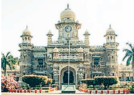
दिग्विजय सिंह ने अपने पत्र में तीखे सवाल उठाते हुए कहा है कि डेली कॉलेज कोई साधारण संपत्ति नहीं है जिसे किसी दल की पक्षपातपूर्ण सुविधा के लिए सौंप दिया जाए। उन्होंने इसे एक खतरनाक पैटर्न करार देते हुए कुछ पिछली घटनाओं का भी जिक्र किया है। सिंह के अनुसार, सितंबर 2025 में भी कॉलेज के गेट और परिसर में बाघ झंड़े व बैनर लगाए गए थे।

इंदौर के प्रतिष्ठित डेली कॉलेज में 22 अप्रैल से आयोजित होने जा रहे भारतीय जनता पार्टी के सात राज्यों के वरिष्ठ नेताओं के प्रशिक्षण वर्ग ने राजनीतिक तूल पकड़ लिया है। इस आयोजन की तैयारियों के बीच प्रदेश के पूर्व मुख्यमंत्री और संस्थान के संरक्षक दिग्विजय सिंह ने कड़ा रुख अपनाया है।