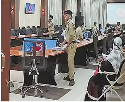
दुर्व्यवहार के साथ नौकरी छोड़ने के बाद हक का पैसा रोकने और धमकाने का आरोप है।

एक्सिस बैंक की पूर्व मैनेजर ने वरिष्ठ अधिकारियों पर शारीरिक, मानसिक शोषण और वित्तीय धोखाधड़ी के आरोप लगाए हैं। पीड़िता ने मंगलवार को कलेक्टर को जनसुनवाई में आवेदन देकर न्याय की गुहार लगाई। शिकायत में कार्यस्थल पर