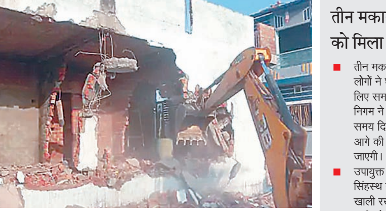
जेसीबी से तोड़े गए निर्माण- नगर निगम की रिमूवल गैंग ने पुलिस प्रशासन के साथ मौके पर पहुंचकर जेसीबी की मदद से अवैध निर्माण ध्वस्त किए। जिन मकानों में अभी छत नहीं डली थी, ऐसे चार निर्माण गिराए गए।

दैनिक अवन्तिका ▶▶ उज्जैन उज्जैन में आगामी सिंहस्थ 2028 को देखते हुए नगर निगम ने प्रतिबंधित क्षेत्र में अवैध निर्माण पर कार्रवाई की। मंगलवार को निगम ने चार निमाणांथीन मकानों को तोड़ दिया, जबकि तीन मकान मालिकों को दो दिन में निर्माण हटाने का समय दिया गया है। नगर निगम के जोन क्रमांक-1 के सिंहस्थ क्षेत्र में उन्हेल नाके के पास कई लोगों ने बिना अनुमति निर्माण कर लिया था। कुछ स्थानों पर निर्माण कार्य जारी भी था, जिस पर निगम ने कार्रवाई की।