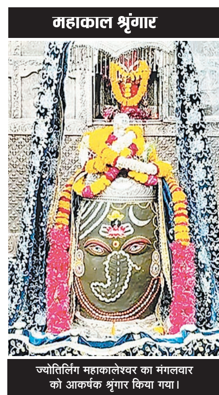
ज्योतिर्लिंग महाकालेश्वर का मंगलवार को आकर्षक श्रृंगार किया गया।

टंकी है तो मिल क्यों नहीं रही शहर में खाद्य मस के लिए जिधर देखो उधर लाइनें लगा रही हैं। एजेंसी के बाहर से लेकर गोदाम तक और वहां से लेकर डिस्ट्रीब्यूशन पाइंट तक यही हाल कायम हो रहे हैं। नियमों के तहत उपभोक्ता से बात की जा रही है। बराबर उसके दिन मिने जा रहे हैं और उसके बाद भी सप्लाय में अधिक दिन लगाकर टंकी दी जा रही है। उपभोक्ता के घर तक टंकी नहीं पहुंचाई जा रही है उससे बराबर इसका चार्ज लिया जा रहा है। उपभोक्ता को टंकी लाने ले जाने के लिए आटो टैक्सी का सहारा लेना पड़ रहा है जिससे उसे अतिरिक्त व्यय करना पड़ रहा है। उपभोक्ता बराबर सवाल उठा रहे हैं कि उपलब्धता को लेकर जिला स्तर से कहा जाता है कि पर्याप्त सप्लाय मिल रहा है तो फिर वो कहाँ जा रहा है।