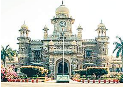
दिग्विजय सिंह ने अपने पत्र में तीखे सवाल उठाते हुए कहा है कि डेली कॉलेज कोई साधारण संपत्ति नहीं है जिसे किसी दल की पक्षपातपूर्ण सुविधा के लिए सौंप दिया जाए। उन्होंने इसे एक खतरनाक पैटर्न करार देते हुए कुछ पिछली घटनाओं का भी जिक्र किया है। सिंह के अनुसार, सितंबर 2025 में भी कॉलेज के गेट और परिसर में पहुंचा झंडे व बैनर लगाए गए थे।

इंदौर के प्रतिष्ठित डेली कॉलेज में 22 अप्रैल से आयोजित होने जा रहे भारतीय जनता पार्टी के सात राज्यों के वरिष्ठ नेताओं के प्रशिक्षण वर्ग ने राजनीतिक तूल पकड़ लिया है। इस आयोजन की तैयारियों के बीच प्रदेश के पूर्व मुख्यमंत्री और संस्थान के संरक्षक दिग्विजय सिंह ने कड़ा रुख अपनाया है।