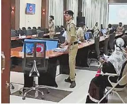
दुर्व्यवहार के साथ नौकरी छोड़ने के बाद हक का पैसा रोकने और धमकाने का आरोप है।

एक्सिस बैंक की पूर्व मैनेजर ने वरिष्ठ अधिकारियों पर शारीरिक, मानसिक शोषण और वित्तीय धोखाधड़ी के आरोप लगाए हैं। पीड़िता ने मंगलवार को कलेक्टर को जनसुनवाई में आवेदन देकर न्याय की गुहार लगाई। शिकायत में कार्यस्थल पर