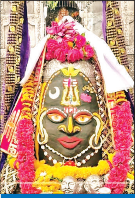
ज्योतिर्लिंग महाकालेश्वर का शनिवार को आकर्षक श्रृंगार किया गया।