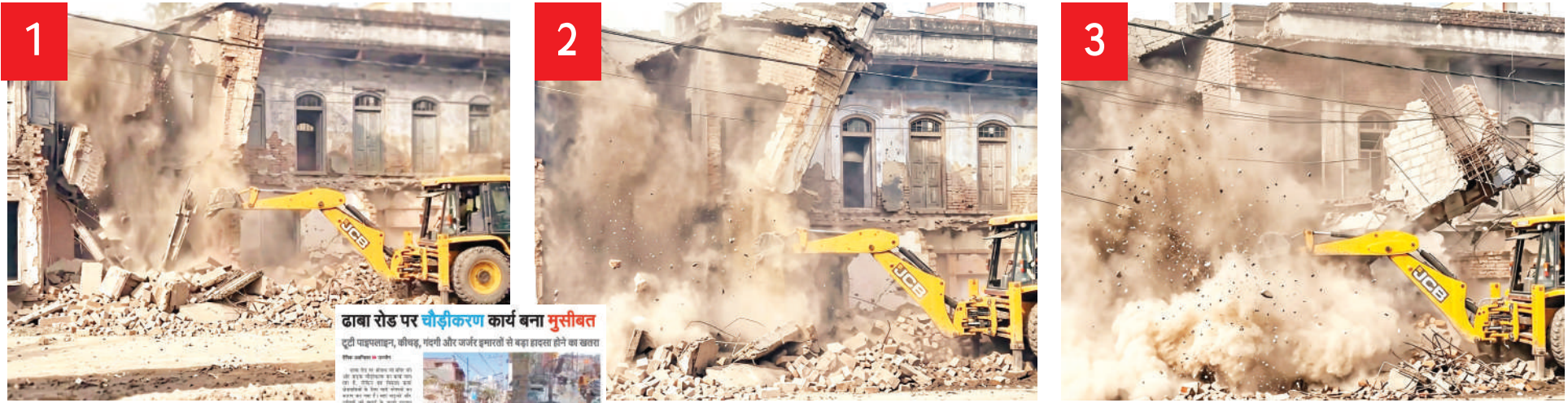
दैनिक अवन्तिका >> उज्जैन

शनिवार को ढाबा रोड पर चौड़ीकरण के चलते की जा रही तोड़फोड़ के दौरान एक जर्जर भवन का हिस्सा जेसीबी के ऊपर गिर गया और इस हादसे में चालक बाल बाल बचा।