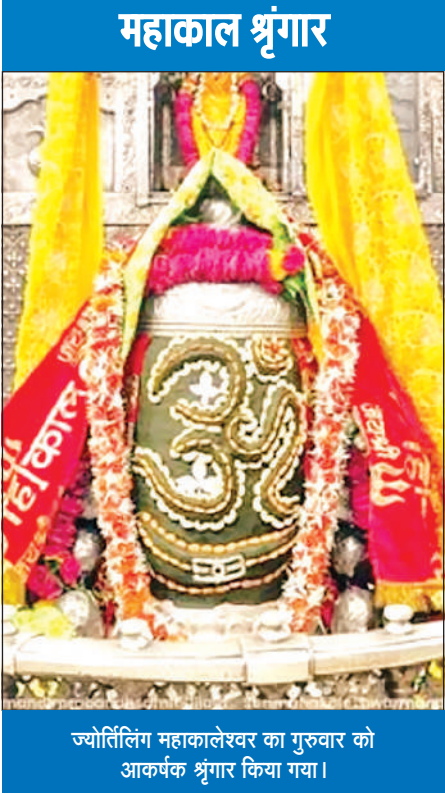
ज्योतिर्लिंग महाकालेश्वर का गुरुवार को आकर्षक श्रृंगार किया गया।

हाथ लकडिया चंदन की जै बोलो यशोदा नंदन की... हीरामिल गेट से पंचक्रोशी यात्रियों ने उत्साह से किया नगर प्रवेश