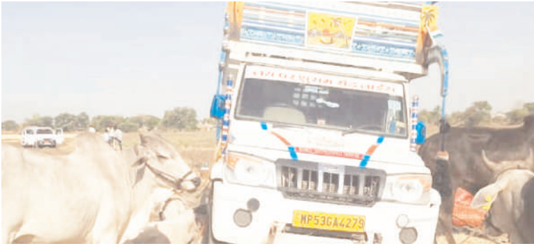
अनियंत्रित होकर खेत में उतर गई।

आगर की ओर से आ रही लोडिंग में मवेशी भरे होने की खबर मिलने पर गौरक्षकों ने पीछा किया तो चालक उन्हेल मार्ग पर लोडिंग छोड़ भाग निकला। 7 मवेशियों को प्याज से भरे कट्टों के नीचे छुपाकर वध के लिये ले जाया जा रहा था। गुरुवार को लोडिंग पिकअप एमपी 53 जीए 4279 में पशुओं को भरकर लाया जा रहा था। आगर की ओर से आ रही पिकअप की खबर गौरक्षकों को मिली तो उन्होने रोकने का प्रयास किया, लेकिन चालक ने रफतार तेज कर गाड़ी उन्हेल रोड की ओर मोड़ ली। पिकअप के ऊपरी हिस्से में प्याज के कट्टे भरे थे। गौरक्षकों ने पीछा नहीं छोड़ा। इस दौरान ग्राम चक्रावदा के समीप पिकअप का एक पहिया निकल गया और पिकअप