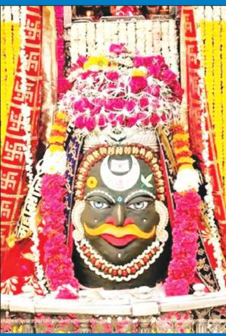
ज्योतिर्लिंग महाकालेश्वर का मंगलवार को आकर्षक श्रृंगार किया गया।