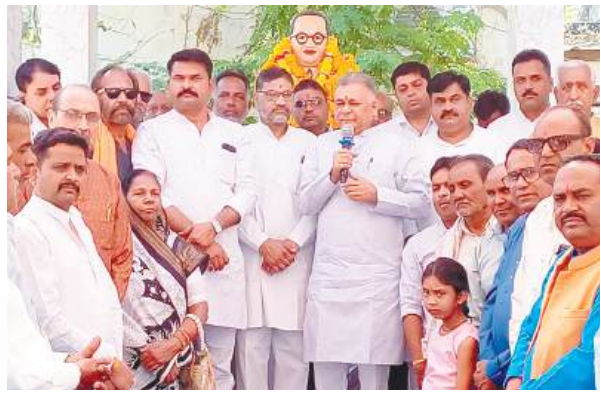
दैनिक अवन्तिका ▶▶ शुजालपुर