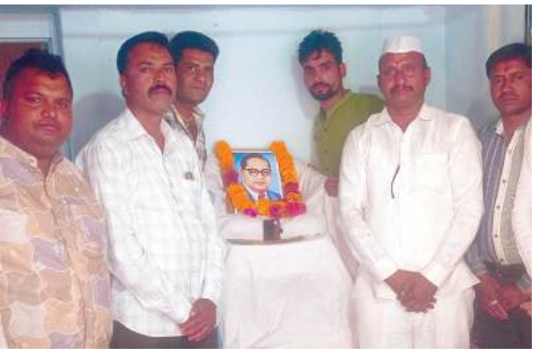
दैनिक अवन्तिका ▶▶ शुजालपुर

शुजालपुर सिटी स्थित अंबेडकर पार्क में मंगलवार को डॉ. भीमराव अंबेडकर बाबा साहब की जयंती श्रद्धा और सम्मान के साथ मनाई गई। ब्लॉक कांग्रेस के तत्वावधान में आयोजित कार्यक्रम प्रातः 9 बजे प्रारंभ हुआ, जिसमें बड़ी संख्या में जनप्रतिनिधि, कार्यकर्ता एवं नागरिक शामिल हुए। कार्यक्रम में उपस्थितजनों ने बाबा साहब की प्रतिमा पर माल्यार्पण कर उन्हें श्रद्धांजलि अर्पित की। वक्ताओं ने उनके जीवन और योगदान को याद करते