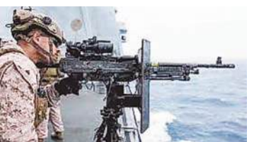
अधिकारी ने बताया कि मंगलवार को अमेरिकी युद्धपोत ने दो तेल टैंकरों को रोक दिया, जो ओमान की खाड़ी में स्थित ईरान के चाबहार बंदरगाह से बाहर निकलने की कोशिश कर रहे थे। रिच स्टैरी और इसकी मालिक कंपनी शंघाई जुआनरन शिपिंग पर अमेरिका ने 2023 से प्रतिबंध लगा रखा है, क्योंकि वे ईरान के साथ व्यापार कर रहे थे।

यह टैंकर खाड़ी से निकलने की कोशिश कर रहा था। लेकिन होर्मुज के आगे अमेरिकी नाकाबंदी की वजह से इसे वापस लौटाना पड़ा। इससे पहले भी इस टैंकर ने मंगलवार को होर्मुज पार करने की कोशिश की थी। रॉयटर्स के मुताबिक एक अमेरिकी