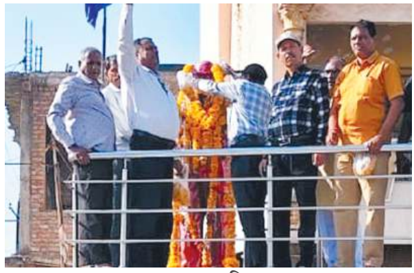
दैनिक अवन्तिका ▶▶ शुजालपुर