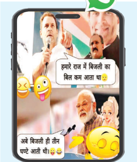
हमारे राज में बिजली का बिल कम आता था। अब बिजली ही तीन घण्टे आती थी।