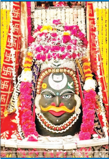
ज्योतिर्लिंग महाकालेश्वर का मंगलवार को आकर्षक श्रृंगार किया गया।