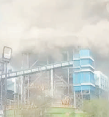
मौके पर पहुंचे। जानकारी के मुताबिक ट्यूब फटने से हादसा हुआ है।