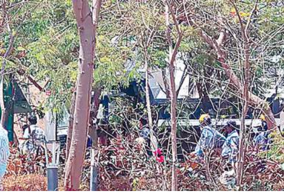
के कारणों का पता लगाया जा रहा नगर पुलिस अधीक्षक रवि सोनेर ने बताया कि हम घटनास्थल की जांच कर रहे हैं। फिलहाल किसी भी व्यक्ति के घायल होने की खबर नहीं है। स्थिति नियंत्रण में है और धमाके के कारणों का पता लगाया जा रहा है।