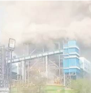
मौत पर पहुंचे। जानकारी के मुताबिक ट्यूब फटने से हादसा हुआ है।