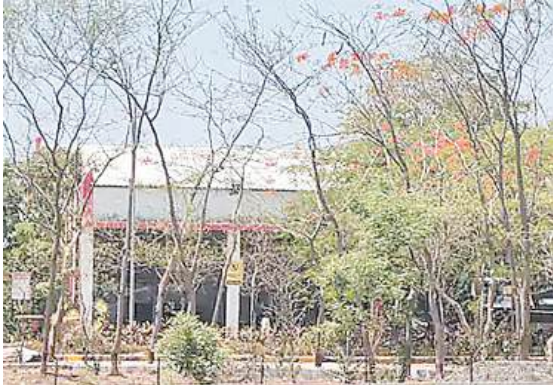
किए। ग्रामीणों ने बताया कि धमाकों के कारण उनके घरों में रखे बर्तन और टेलीविजन तक स्टैंड से नीचे गिर गए। घटना की सूचना मिलते ही पुलिस बल मौके पर पहुंचा। प्रारंभिक जानकारी के अनुसार, इस घटना में किसी के हताहत होने की खबर नहीं है। एसपी बोले- धमाके

विस्फोटों को तीव्रता इतनी अधिक थी कि कंपनी के निकटवर्ती तारपुरा और बजरंगपुरा गांवों में लोगों ने झटके महसूस