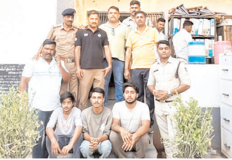
और ऊपरी मंजिल पर किरायेदार रहते हैं। पुलिस ने अज्ञात के खिलाफ चोरी का प्रकरण दर्ज कर जांच शुरू की। इस दौरान

ऋषिनगर एक्सटेंशन में रहने वाले परिवार के मकान में हुई लाखों के आभूषणों की चोरी में किराये से रहकर सीडीएस की तैयारी कर रहा छात्र आरोपी होना सामने आया है। शौक पूरा करने के लिये उसने चोरी को अंजाम दिया था। छात्र के साथ उसके 2 साथियों को गिरफ्तार किया गया है। तीनों से 2 दिनों की रिमांड पर पूछताछ जारी है।