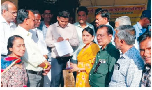
शिक्षकों की मांगों को लेकर संयुक्त मोर्चा का ज्ञापन