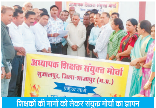
शिक्षकों की मांगों को लेकर संयुक्त मोर्चा का ज्ञापन