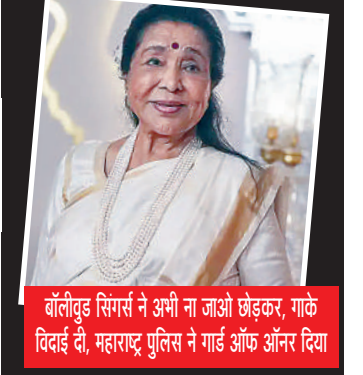
बॉलीवुड सिंगर ने अभी ना जाओ छेड़कर, गाके विदाई दी, महाराष्ट्र पुलिस ने गाई ऑफ ऑनर दिया

मुंबई। सिंगर आशा भोसले का राष्ट्रीय सम्मान के साथ शिवाजी पार्क रमेशान घाट पर अंतिम संस्कार हुआ। उन्हें महाराष्ट्र पुलिस ने गाई ऑफ ऑनर दिया। बॉलीवुड सिंगर ने उनका गाना अभी ना जाओ छेड़कर गाकर विदाई दी। सोमवार सुबह उनका पार्थिव शरीर अंतिम दर्शन के लिए उनके मुंबई स्थित उनके निवास कासा ग्रांड में रखा गया था। उन्हें तिरंगे में लपेटकर सलामी दी गई। उनका रविवार को मुंबई के ब्रीच केडी अस्पताल में निधन हो गया था। वे 92 साल की थीं। आशा भोसले ने 82 साल के सिंगिंग करियर में 9 फिलिमरियर समेत 100 से अधिक अवॉर्ड जीते। उन्हें देश के दूसरे सबसे बड़े नागरिक सम्मान पद्म विभूषण से सम्मानित किया गया था।