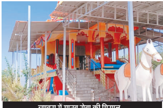
ब्यावरा में मानव सेवा की मिसाल -