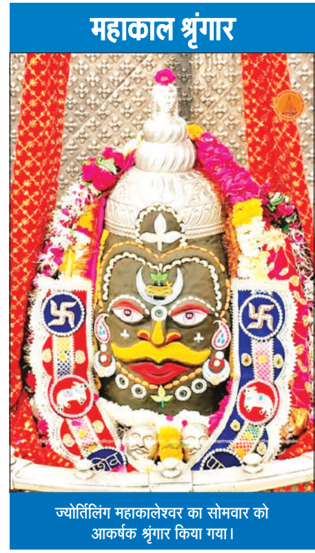
ज्योतिर्लिंग महाकालेश्वर का सोमवार को आकर्षक श्रृंगार किया गया।