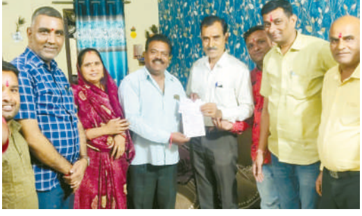
शिक्षकों की मांगों को लेकर संयुक्त मोर्चा का ज्ञापन