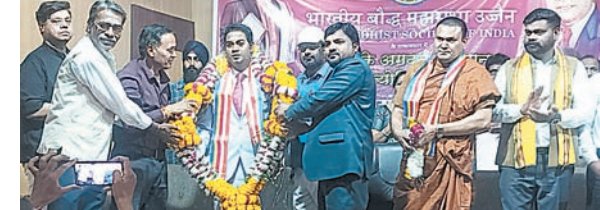
दैनिक अवन्तिका ▶ उज्जैन