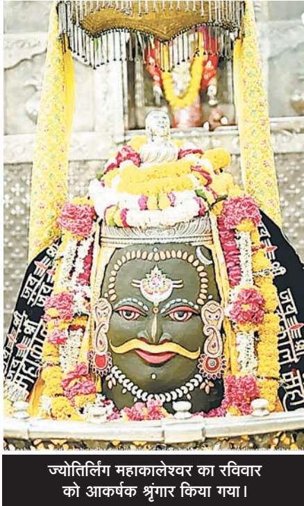
ज्योतिर्लिंग महाकालेश्वर का रविवार को आकर्षक श्रृंगार किया गया।