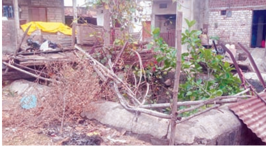
चित्र में एसडीएम ग्रामीणों से चर्चा करते हुए पुराने कुएं बावड़ी कचरे के ढेर में तब्दील

पेयजल समस्या का मुख्य कारण जल स्तर नीचे गिरने के साथ पी एच ई विभाग भी है, दो साल पहले जल जीवन मिशन के तहत जगोटी में घर घर पेयजल सुलभता से प्रदाय करने का काम अब भी अधूरा है, गांव में सड़क खोदकर बिछाई पाईप के कारण गांव की आंतरिक सड़कों को बदतर हालात में पहुंचा कर हर गली में को आवागमन लायक भी नहीं छोड़ा। नयी पाईप लाईन बिछाने का इस कदर घटिया तरीके से किया गया कि पैतालीस साल पहले की नल जल योजना की पाईप लाईन नष्ट कर पेयजल आपूर्ति बाधित कर दी। जगोटी खेडाखजूरीया मार्ग पर पीएच ई के ट्यूबवेल से पूरे वर्ष भर जल आपूर्ति होती थी मगर दो साल पहले उस ट्यूबवेल के समीप पुलिया निर्माण के दौरान ठेकेदार द्वारा उक्त ट्यूबवेल को पत्थरों व मिट्टी मिट्टी से बंद कर उपयोग हीन कर दिया, ग्राम पंचायत जगोटी ने इस्को लेकर शिकायती