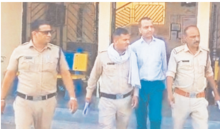
दैनिक अवन्तिका &gt;&gt; उज्जैन

केन्द्र सरकार का संयुक्त सचिव बताकर परिवार के साथ महाकालेश्वर मंदिर में भस्मरती की विशेष अनुमति मांगने वाले व्यक्ति का राज उस वक्त खुल गया, जब उससे परिचय पत्र मांगा गया।