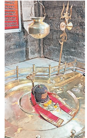
दैनिक अवन्तिका ▶ उज्जैन पं. राहुल शुक्ल

118 किलोमीटर की दुर्गम पंचकोशी यात्रा का दूसरा पड़ाव है ग्राम करोहन स्थित कायावरोहणेश्वर मंदिर। धार्मिक मान्यतानुसार ये शहर की दक्षिण दिशा के द्वारपाल हैं। महाकालेश्वर व अर्वाति के चार दिशाओं के द्वारपाल का वर्णन स्कंदपुराण के अर्वातिखण्ड में सविस्तार है। काया मतलब शरीर और कायावरोहणेश्वर अर्थात् काया की रक्षा करके उसे सदैव कानियुक्त रखनेवाले देव। प्रजापति दक्ष के यज्ञ से कुपित हो कालों के काल महाकाल ने वीरभद्र को उत्पन्न किया और पति के अपमान में जल रही माता सती ने भू पर नाक रगड़कर अट्टुस करती भद्रकाली को उत्पन्न किया।