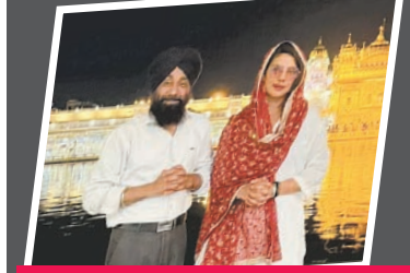
लंगर हॉल में जूटे बर्तन मांजे, अमृतसर में शूटिंग कर रही थी,

12 दिन में दूसरी बार आई प्रियंका चोपड़ा ने गोल्डन टैपल में माथा टेका