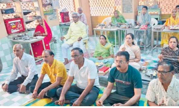
दैनिक अवन्तिका ▶▶ सारंगपुर