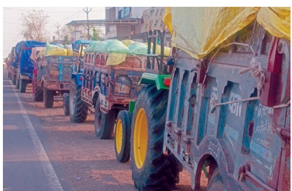
दैनिक अवन्तिका ▶▶ सारंगपुर।

वर्ष 26 -27 समर्थन मूल्य की खरीदी कृषि उपज मंडी तनोडिया में आज शाखा द्वारा गेहूं समर्थन मूल्य खरीदी का श्री गणेश किया गया।