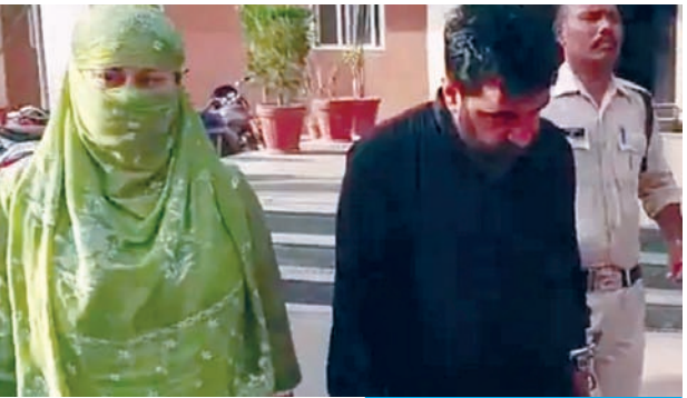
रेलवे स्टेशन से पकड़े गए आरोपी

सीएसपी सुमित अग्रवाल ने बताया कि डॉक्टरों ने आवेदन में कहा है कि वे अपना काम करने में असहज महसूस कर रहे हैं और कुछ लोग इस मौके का फायदा उठाकर उन्हें परेशान कर रहे हैं। इस मामले में अब तक कुल पांच आरोपियों को गिरफ्तार किया जा चुका है। कोतवाली पुलिस ने मरीज बनकर डॉक्टरों से बातचीत करने, रिटिंग ऑपरेशन करने और ब्लैकमेल करने के आरोप में सात लोगों के खिलाफ प्रकरण दर्ज किया है।