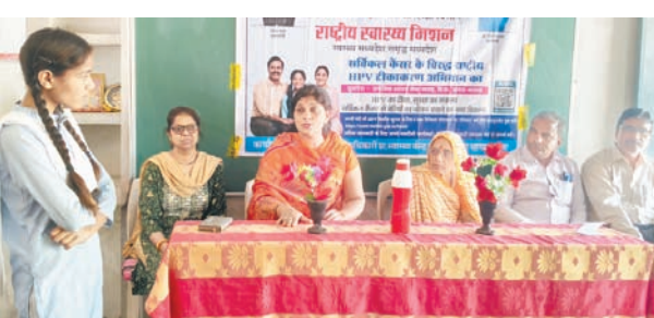
दैनिक अवन्तिका ▶▶ कानड

नगर के नेताजी सुभाष पब्लिक हायर सेकेंडरी स्कूल में सर्वाइकल कैंसर HPV टीकाकरण को लेकर एक महत्वपूर्ण जागरूकता कार्यक्रम आयोजित किया गया। कार्यक्रम में बालिकाओं एवं उनके अभिभावकों को एचपीवी वैक्सीन के महत्व, उपयोगिता और सुरक्षा के बारे में विस्तार से जानकारी दी गई।