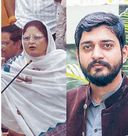
हे तो वह यह सुनते ही भड़क गईं। उन्होंने कहा कि कांग्रेस पार्टी भाड़ में जाए। ऐसे जब भी मौके आते हैं