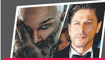
एसआरके ने फिल्म राका के फर्स्टलुक को शानदार बताया, लोग बोले- धुरंधर 2 पर चुप क्यों