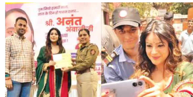
अभिनेत्री शहनाज गिल हाल ही में एक ब्लड डोनेशन कैंप में पहुंचीं। इस कैंप का आयोजन अनंत अंबानी के जन्मदिन के अवसर पर किया गया है।

नामी बिजनेसमैन मुकेश अंबानी और नीता अंबानी के छोटे बेटे अनंत अंबानी का 10 अप्रैल को जन्मदिन है। मगर, इसका जश्न अभी से शुरू हो गया है। उनके जन्मदिन का आयोजन जामनगर में होने वाला है। तमाम फिल्मी हस्तियां भी इस सेलिब्रेशन में हिस्सा ले रही हैं। अंबानी परिवार सामाजिक कार्यों के लिए भी जाना जाता है। कोई भी मौका हो, वे समाज सेवा से पीछे नहीं हटते, लिहाजा लोग भी उन्हें खूब प्यार करते हैं। आज अनंत अंबानी के बर्थडे के मौके पर रक्तदान शिविर आयोजित हुआ। यहां एक्ट्रेस शहनाज गिल भी पहुंचीं।