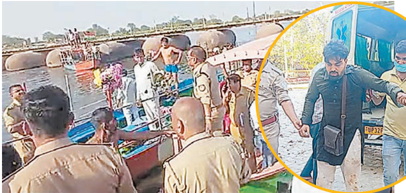
पुलिस की टीम ने गोताखोरों की मदद से 15 लोगों को सुरक्षित बाहर निकाल लिया। इनमें से एक श्रद्धालु को संयुक्त चिकित्सालय में भर्ती कराया गया है। दुःख

उत्तर प्रदेश के वृंदावन में शुक्रवार दोपहर एक बड़ा हादसा हो गया। केसी घाट पर श्रद्धालुओं से भरी एक नाव पलटने से टकराकर यमुना नदी में पलट गई। पुलिस और स्थानीय प्रशासन मिलकर बड़े पैमाने पर बचाव अभियान चलाया। गोताखोर यमुना के गहरे पानी में डूबे हुए लोगों की तलाश में जुटे हैं। इस दुर्घटना में नाव सवार करीब 25 से 30 श्रद्धालु यमुना के पानी में डूब गए।