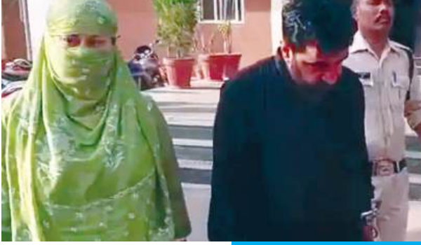
रेलवे स्टेशन से पकड़े गए आरोपी