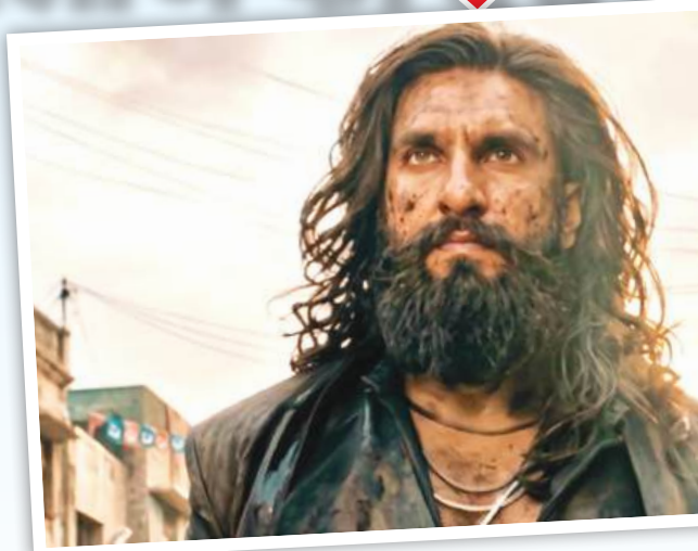
मई-जून में ओटीटी पर दस्तक दे सकती है फिल्म

19 मार्च को सिनेमाघरों में रिलीज हुई 'धुरंधर 2' का फैंस ओटीटी पर आने का इंतजार कर रहे हैं। हालांकि, अभी तक मेकर्स ने फिल्म की ओटीटी रिलीज डेट जारी नहीं की है। लेकिन फिल्म के प्रोमो और पोस्ट से ये पता चलता है कि 'धुरंधर 2' की स्ट्रीमिंग ओटीटी प्लेटफॉर्म जियोहॉटस्टार पर होगी। पोस्टर में जियोहॉटस्टार का लोगो है, जिससे पता चलता है कि सिनेमाघरों में रिलीज होने के बाद फिल्म इस प्लेटफॉर्म पर स्ट्रीम होगी।