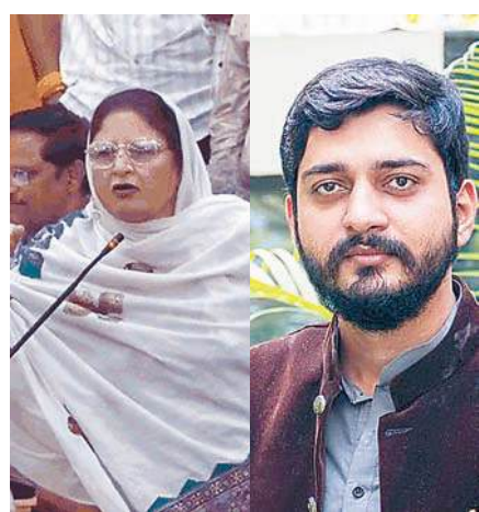
हे तो वह यह सुनते ही भड़क गईं। उन्होंने कहा कि कांग्रेस पार्टी भाड़ में जाए। ऐसे जब भी मौके आते हैं