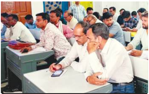
पुस्तक मेले को लेकर अशासकीय विद्यालयों की बैठक