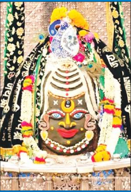
ज्योतिर्लिंग महाकालेश्वर का बुधवार को आकर्षक श्रृंगार किया गया।