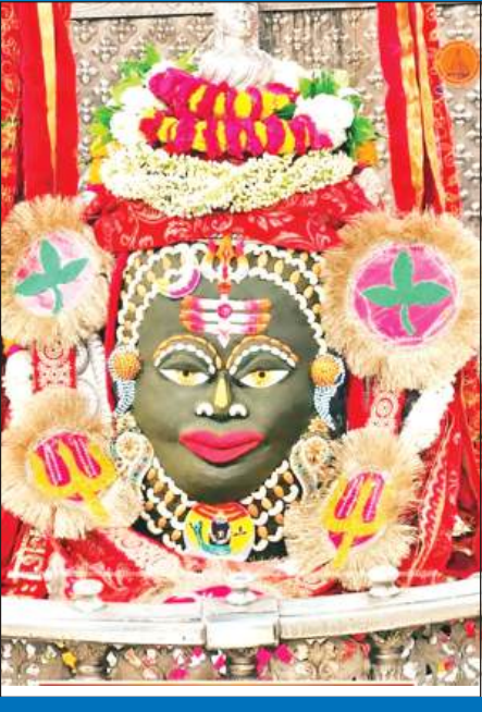
ज्योतिर्लिंग महाकालेश्वर का मंगलवार को आकर्षक श्रृंगार किया गया।