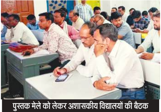
पुस्तक मेले को लेकर अशासकीय विद्यालयों की बैठक