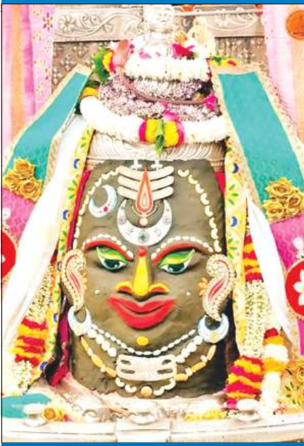
ज्योतिर्लिंग महाकालेश्वर का सोमवार को आकर्षक श्रृंगार किया गया।