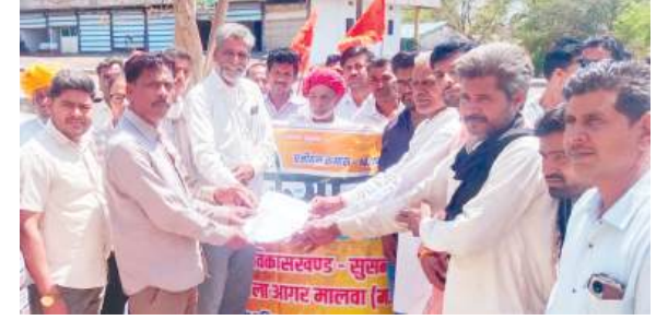
किसानों की समस्याओं को लेकर तहसील कार्यालय पहुंचे किसान

मानवता शर्मसार, नाले में मिला नवजात का शव सुसनेर। नगर के नरबंदिया नाला स्थित पुलिया के नीचे सोमवार को एक हृदय विदारक घटना सामने आई जिसने पूरे क्षेत्र को झकझोर कर रख दिया। नाले में एक शिशु का शव मिलने से इलाके में सनसनी फैल गई और देखते ही देखते मौके पर लोगों की भीड़ जमा हो गई। इस घटना ने मानवता को शर्मसार कर दिया है और नगरवासियों में आक्रोश व दुःख का माहौल बना हुआ है। प्राप्त जानकारी के अनुसार सुबह किसी राहगीर की नजर पुलिया के नीचे नाले में पड़े शव पर पड़ी जिसके बाद उसने आसपास के लोगों को सूचना दी। देखते ही देखते बड़ी संख्या में लोग घटनास्थल पर पहुंच गए। प्रारंभिक जांच में यह शव करीब 5 माह के गर्भस्थ शिशु का प्रतीत हो रहा है। आशंका जताई जा रही है कि किसी अज्ञात व्यक्ति द्वारा भ्रूण को यहां लाकर नाले में फेंक दिया गया। घटना की सूचना मिलते ही थाना प्रभारी अक्षय सिंह बेस पुलिस बल के साथ मौके पर पहुंचे और आवश्यक कार्रवाई शुरू की। पुलिस ने मौके का बारीकी से निरीक्षण कर साक्ष्य जुटाए और शव को कब्जे में लेकर पोस्टमार्टम के लिए सिविल अस्पताल भेज दिया। अस्पताल में चिकित्सकों द्वारा शव का पीएम कर आगे की प्रक्रिया पूरी की गई। प्रथम दृष्टया मामला अवैध रूप से भ्रूण को फेंकने से जुड़ा प्रतीत हो रहा है।