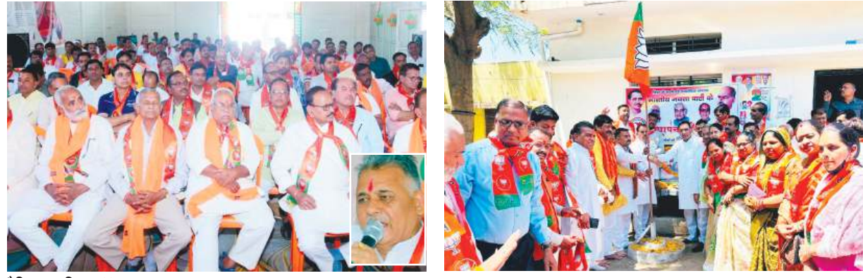
दैनिक अवन्तिका ▶▶ शुजालपुर