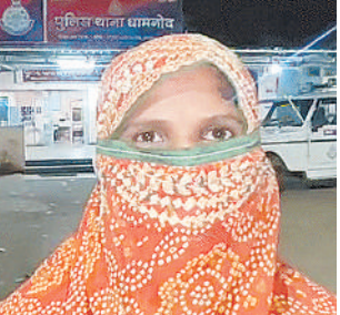
बनी बाउंड्री वालं के खंबे तोड़ दिव। शिकायत करने पर आरोपी बहस करने लगे और लात-धूसों से मारपीट