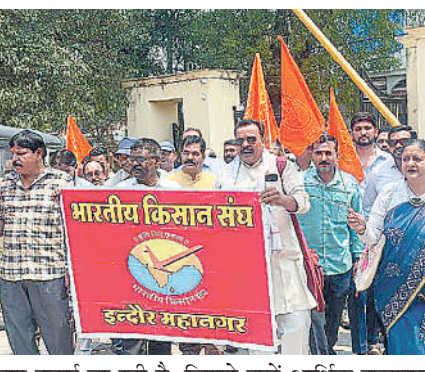
बार बढ़ाई जा रही है, जिससे उन्हें आर्थिक नुकसान उठाना पड़ रहा है। सरकार ने खरीदी की तारीख 10 अप्रैल तक बढ़ाई है, जबकि सहकारी समितियों में भुगतान की अंतिम तारीख 28 मार्च रखी गई ऐसे में किसान पैसे कैसे जमा करें?