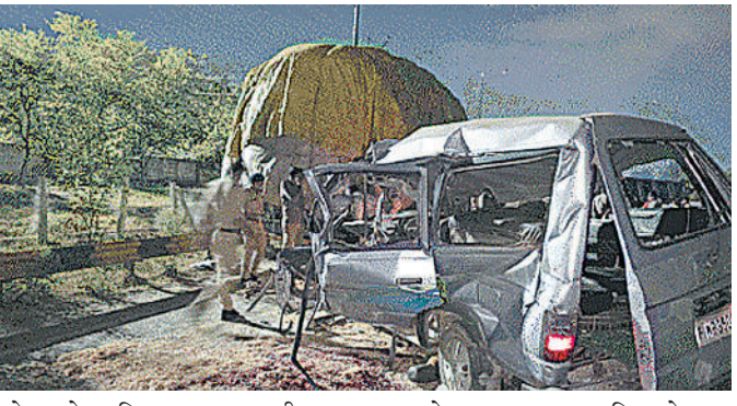
ओवर टेक किया था। इस बीच अचानक ब्रेक लगा दिया। पीछे चल रही कार का ड्राइवर ब्रेक नहीं लगा पाया और कार पीछे से आघात ट्रक में जा घुसी। इससे कार के परखच्चे उड़ गए।

इंदौर में दुल्हन लेकर लौट रही बारातियों से भरी कार (क्वालिंस) ट्रक के पीछे जा घुसी। देवगुराड़िया स्थित ट्रेडिंग ग्राउंड के पास रविवार देर रात हुए इस हादसे में 4 युवकों की मौत हो गई, जबकि 8 लोग गंभीर रूप से घायल हैं। 3 लोगों ने मौके पर दम तोड़ा, जबकि एक की इलाज के दौरान मौत हुई। मृतकों के परिजन के मुताबिक वे शादी समारोह के बाद लौट रहे थे। आगे चल रहे ट्रक में भूसा भरा था। ड्राइवर तेज रफ्तार से चला रहा था। ट्रेडिंग ग्राउंड के पास उसने एक गाड़ी को