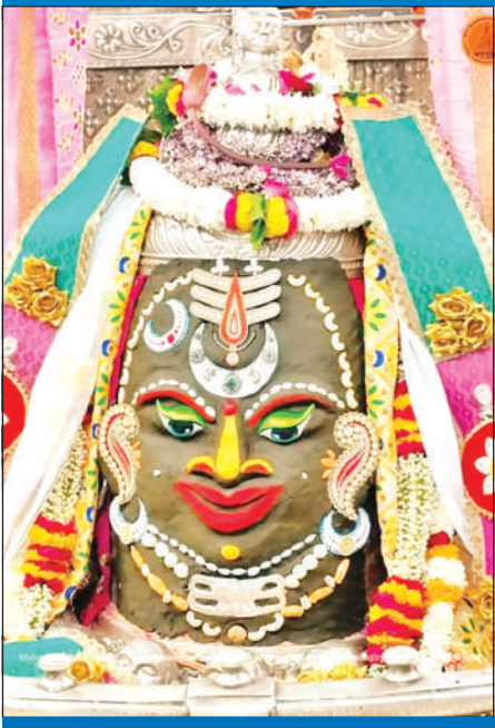
ज्योतिर्लिंग महाकालेश्वर का सोमवार को आकर्षक श्रृंगार किया गया।