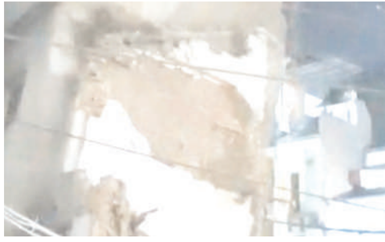
थे। शाम को अचानक दोनों तीन मंजिला मकान ताश के पत्तों की तरह धराशायी हो गये। जैसे ही मकान जमीन पर गिरे धुएँ का गुब्बारा उठा और मार्ग पर लगे बिजली के तार टूटने पर चिंगारी निकली। मकानों के गिरने पर सामने की ओर बने प्रकाश धानी के

ढाबा रोड चौड़ीकरण में सोमवार देर शाम तीन मंजिला मकान अचानक गिर गया। मकान के गिरते ही धुएँ का गुब्बारा उठा और अफरा-तफरी मच गई। इस दौरान सामने बने 2 मकान भी क्षतिग्रस्त हो गये। हादसे के बाद क्षेत्र में अंधेरा छा गया। गनीमत रही कि जनहानि नहीं हुई।