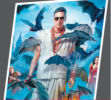
अक्षय, राजपाल और परेशा रावल पुराने अंदाज में दिखें, हॉरर और कॉमेडी का वॉलेंस नजर आया

मुंबई। अक्षय कुमार की मोस्ट अवेटेड फिल्म भूत बंगला का ट्रेलर आखिरकार रिलीज हो गया है। प्रियदर्शन के निर्देशन में बनी इस फिल्म का ट्रेलर दर्शकों को पुराने दिनों की याद दिलाता है। इसमें अक्षय कुमार के साथ उनकी पुरानी कॉमेडी टीम यानी परेशा रावल और राजपाल यादव भी नजर आ रहे हैं। फिल्म में हॉरर और कॉमेडी का बेसा ही बलेंस दिख रहा है, जिसके लिए अक्षय और प्रियदर्शन की जोड़ी जानी जाती है। ट्रेलर को देखकर लग रहा है कि मेकर्स ने इसे बिना किसी तामझाम के काफी सरल और मनोरंजक रखा है। फिल्म का ट्रेलर उच्च रेटिंज स्पेस में ले जाता है, जिसमें अक्षय और प्रियदर्शन सालों से काम करते आए हैं। ट्रेलर की लय काफी तेज और मजेदार है। इसमें कॉमेडी के साथ स्पूकी (डरफुल) एलिमेंट्स का इस्तेमाल किया गया है, लेकिन पुलिस भी ओवरडन या जबरदस्ती नहीं लाता। फिल्म की राइटिंग काफी सहज नजर आ रही है। ट्रेलर के आखिर तक आते-आते दर्शकों की जिज्ञासा फिल्म को लेकर काफी बढ़ जाती है। फिल्म की सच्ची बड़ी ताकत इसकी कार्टिंग है। अक्षय कुमार एक बार फिर उसी जॉनर में लौटे हैं जो उन पर सबसे ज्यादा सूट करता है। उनके साथ परेशा रावल और राजपाल यादव की टाइटनिंग हमेशा की तरह दिख रही है। साथ ही असरानी ने भी अपने दिग्-परिचित अंदाज में कॉमेडी का तड़का लगाया है। इन दिग्गजों के अलावा फिल्म में याफिका चव्वा, तब्बू, जिशु सेनगुप्त और मिथिला पालकर जैसे कलाकार भी अहम भूमिकाओं में हैं।