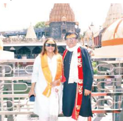
उज्जैन। प्रसिद्ध फिल्म अभिनेता अतुल श्रीवास्तव ने श्री महाकालेश्वर मंदिर पहुंचकर भगवान श्री महाकालेश्वर जी के दर्शन किए।