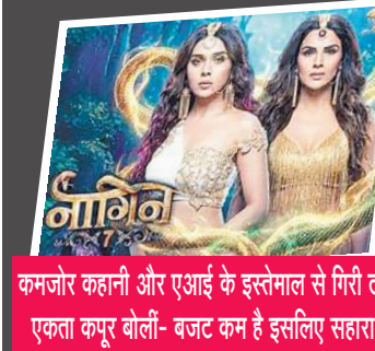
कमजोर कहानी और एआई के इस्तेमाल से गिरी टीआरपी