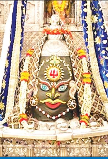
ज्योतिर्लिंग महाकालेश्वर का शनिवार को आकर्षक श्रृंगार किया गया।