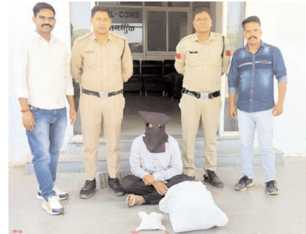
जानकारी के अनुसार, पुलिस को मुखबिबर से सूचना मिली थी कि मंदसौर-नीमच हाईवे रोड पर अधोरिया फंटा के पास एक व्यक्ति