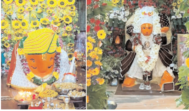
नगर के प्रसिद्ध तलाई वाले बालाजी व बड़े बालाजी का आकर्षक श्रृंगार किया गया