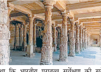
था कि भारतीय पुरातत्व सर्वेक्षण की सर्वे रिपोर्ट, वीडियोग्राफी और पक्षकारों की आपत्तियों पर हाईकोर्ट अंतिम सुनवाई में विचार करेगा। सभी मुद्दे हाईकोर्ट के समक्ष खुले रहेंगे और वहीं तय किए जाएंगे। सुप्रीम कोर्ट ने कहा था-एएसआई द्वारा तैयार की गई सर्वे रिपोर्ट सभी पक्षों को उपलब्ध करा दी गई है। कई पक्षों ने इस पर अपनी आपत्तियां भी दर्ज कराई हैं। एएसआई द्वारा की गई साइट की वीडियोग्राफी और फोटोग्राफी से जुड़े बिंदुओं को भी हाईकोर्ट गंभीरता से देखेगा। यदि वीडियोग्राफी के आधार पर कोई नई आपत्तियां उठती हैं, तो उन पर भी सुनवाई के दौरान विचार किया जाएगा।