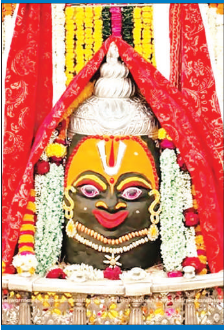
ज्योतिर्लिंग महाकालेश्वर का गुरुवार को आकर्षक श्रृंगार किया गया।