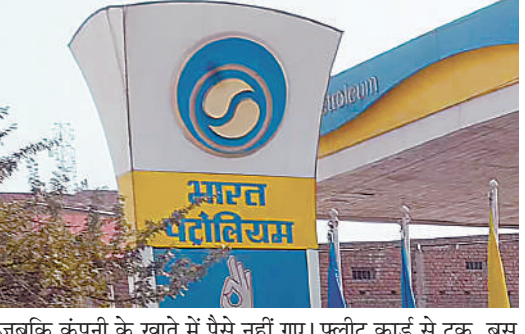
जबकि कंपनी के खाते में पैसे नहीं गए। फ्लैट कार्ड से टुक, बस और अन्य व्यावसायिक वाहनों के लिए जारी किया जाता है। इससे ड्राइवर नकद पैसे रखे बिना पेट्रोल-डीजल भरवा सकते हैं। पैसे सीधे कंपनी के बैंक खाते से कटता है।

इंदौर के मांगलिया स्थित भारत पेट्रोलियम डिपो में 129 करोड़ 55 लाख रूपए की धोखाधड़ी सामने आई है। मामला बीपीसीएल (भारत पेट्रोलियम कॉर्पोरेशन लिमिटेड) के फ्लैट कार्ड और लॉयल्टी ऐप से जुड़ा है। पुलिस ने इंदौर के 7 व्यापारियों और ट्रांसपोर्टरों के खिलाफ केस दर्ज किया।