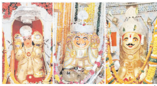
मंदिरों पर महाभारती की

सैलाना रोड स्थित श्री बरबड़ हनुमान मंदिर पर शाम को मेला लगा। मंदिर परिसर को आकर्षक विद्युत रोशनी व मंदिर के गभ्र गृह को फूलों से सजाया है। देर रात तक हजारों की संख्या में श्रद्धालू यहां पहुंचे। सुबह से दर्शन के लिए भक्तों की कतार लगातार लगी हुई है। शहर में शाम को भी कई हनुमान