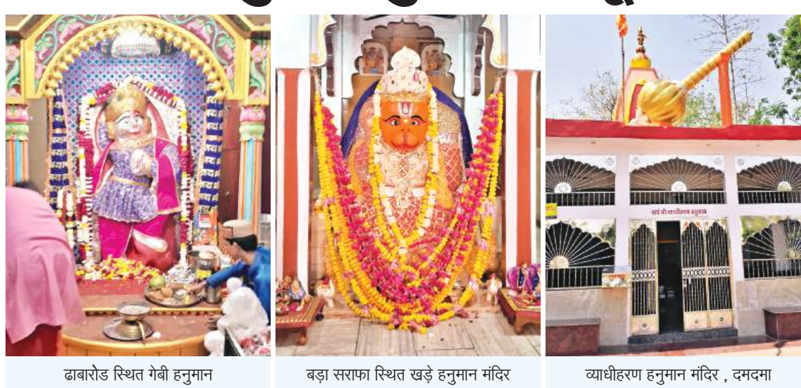
दाबरोड स्थित गेबी हनुमान बड़ा सराफा स्थित खड़े हनुमान मंदिर व्याधीहरण हनुमान मंदिर, दमदमा