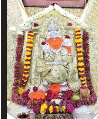
जिसमें बाल हनुमान को बालभोग में नुक्ति का महाभोग लगाया जाएगा। भारतीय के पश्चात इसे भक्तों में वितरित किया जाएगा। दोपहर 2 बजे अखंड रामायण पाठ की पूर्णाहृति होगी। संस्था आरती पश्चात श्री बाल हनुमान जी की रजत प्रतिमा पालकी में विराजित कर उनका विधि विधान के साथ पूजन किया जाएगा। पूजन के बाद श्री बाल हनुमान पालकी में बैठकर भक्तों को दर्शन देने के लिए नगर भ्रमण पर निकलेंगे।