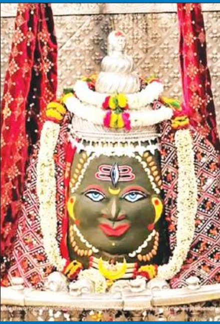
ज्योतिर्लिंग महाकालेश्वर का बुधवार को आकर्षक श्रृंगार किया गया।