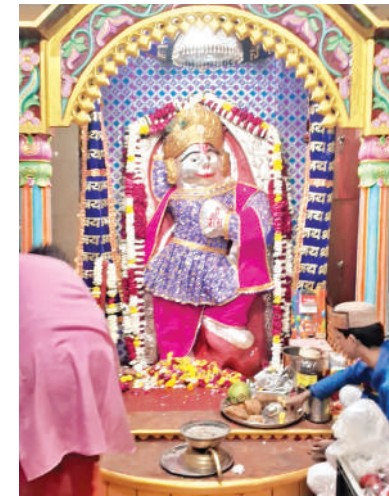
दाबारोड स्थित गेबी हनुमान