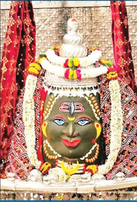
ज्योतिर्लिंग महाकालेश्वर का बुधवार को आकर्षक श्रृंगार किया गया।