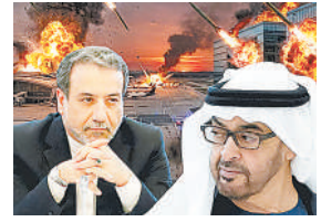
तरीकों का इस्तेमाल करने की अनुमति मांगी जा रही है। इसके तहत हार्मुज सिक्वोरिटी फोर्स बनाई जाएगी, जो जहाजों की सुरक्षा तय करेगी।

संयुक्त अरब अमीरात यूएस-ईरान जंग में सीधे तौर पर शामिल होने की तैयारी कर रहा है। वॉल स्ट्रीट जर्नल की रिपोर्ट के मुताबिक, यूएई संयुक्त राष्ट्र सुरक्षा परिषद में एक प्रस्ताव लाने की कोशिश कर रहा है। इस प्रस्ताव में होर्मुज स्ट्रेट को जबरन खोलने के लिए सभी