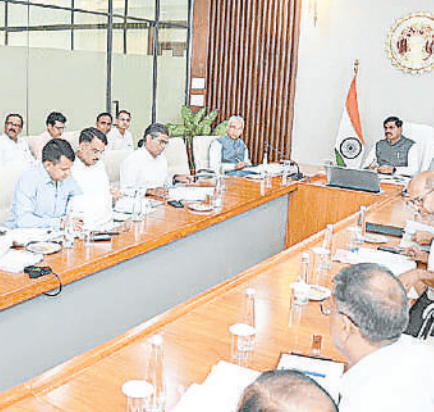
से हार्वेस्टर की परिवहन लागत में कमी आएगी, जिसका सकारात्मक प्रभाव कृषि उपज के मूल्य पर होगा और इसका सीधा फायदा किसानों को होगा।

कंबाइन हार्वेस्टरों को मध्यप्रदेश सड़क विकास निगम के टोल प्लाजा पर टैक्स नहीं देना होगा। राज्य सरकार ने उन्हें टैक्स में छूट दे दी है। सड़क विकास निगम के संचालक मंडल की बैठक में यह निर्णय लिया गया है। बैठक बुधवार को मुख्यमंत्री निवास स्थित समत्व भवन में आयोजित हुई। जिसकी अध्यक्षता मुख्यमंत्री डॉ. मोहन यादव ने की। मुख्यमंत्री ने कहा कि फसल कटाई में प्रयुक्त होने वाला कंबाइन हार्वेस्टर आवश्यक कृषि उपकरण है। टोल मार्गों पर टोल छूट दिए जाने