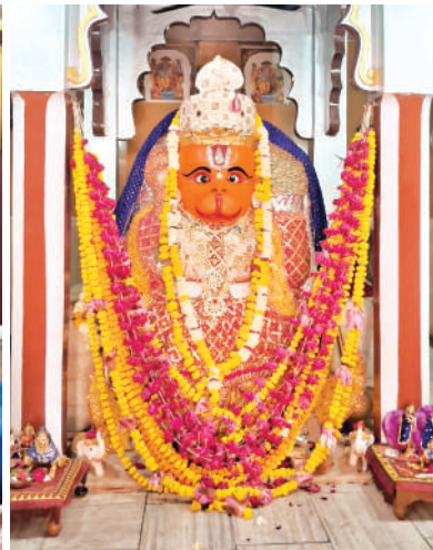
बड़ा सराफा स्थित खड़े हनुमान मंदिर