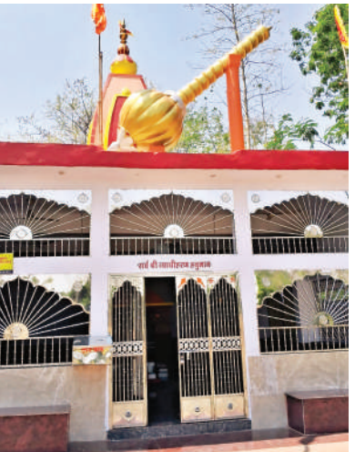
व्याधीहरण हनुमान मंदिर , दमदमा