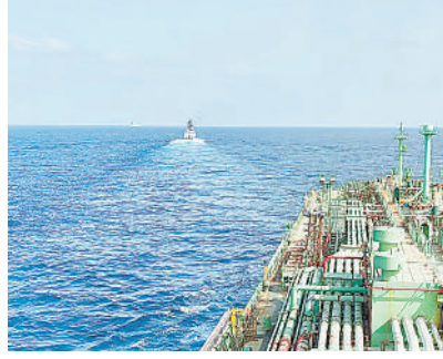
जहाजों में करीब 94,000 टन एलपीजी और 50 से ज्यादा भारतीय नाविक भी मौजूद थे। सरकार के मुताबिक, अब तक 8 भारतीय जहाज सुरक्षित रूप से होर्मुज स्ट्रेट पार कर चुके हैं।

पहला टैंकर इह टीवायआर 31 मार्च को मुंबई पहुंचा। यह जहाज यूएई के रास अल खैमाह से चला था और करीब 6 दिन में भारत पहुंचा। दूसरा टैंकर बौडब्यूक ईएलएम 1 अप्रैल को न्यू मंगलोर के पास पहुंचा। इन दोनों