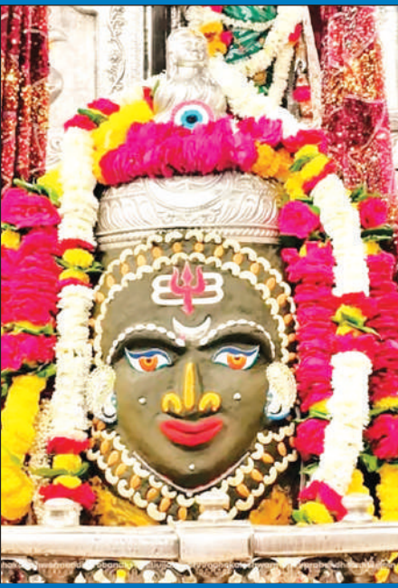
ज्योतिर्लिंग महाकालेश्वर का मंगलवार को आकर्षक श्रृंगार किया गया।