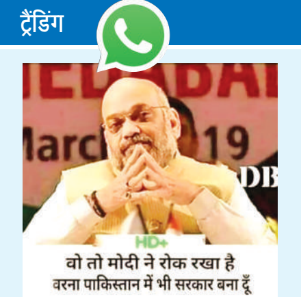
वो तो मोदी ने रोक रखा है वरना पाकिस्तान में भी सरकार बना दूँ