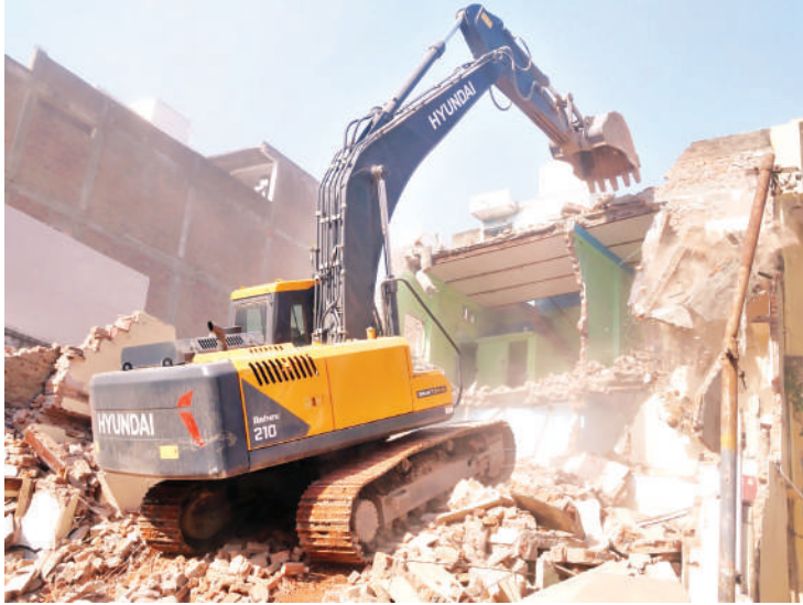
महाकाल मंदिर मार्ग के 12 मकान पर चला बुलडोजर

महाकाल मंदिर दर्शन करने आने वाले श्रद्धालुओं के लिए जल्द ही एक और मार्ग चौड़ा होने जा रहा है जिससे भक्त आसानी से मंदिर तक पहुंच सकेंगे। मंगलवार को नगर निगम की टीम ने भारत माता पार्किंग स्थल से अहिल्याबाई चौराहे तक 15 मीटर चौड़ीकरण के अंतर्गत मार्ग में आ रहे भवनों को नगर निगम द्वारा जेसीबी एवं पोकलेन के माध्यम से हटाया गया, स्मार्ट सिटी के द्वारा अहिल्याबाई चौराहा जो कि बेगम बाग मार्ग से भारत माता पार्किंग स्थल तक 15 मीटर की चौड़ाई के साथ उक्त मार्ग का निर्माण किया जाएगा मार्ग में 14 भवनों में बेगमबाग से स्मार्ट पार्किंग के बीच बाधक बन रहे 12 मकानों को जेसीबी से तोड़ दिया।