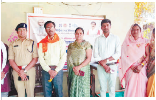
शुजालपुर में आपदा प्रबंधन प्रशिक्षण कार्यक्रम सम्पन्न