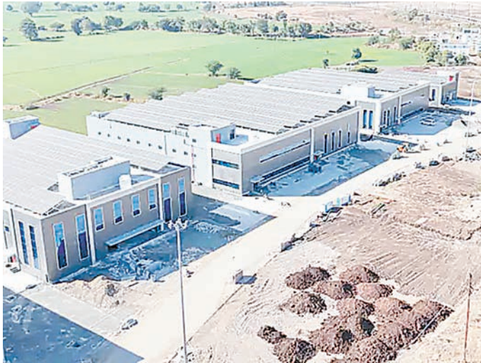
आवर्तित कर दी गई है। मेडिकल डिवाइस पार्क में अत्याधुनिक चिकित्सा उपकरणों का निर्माण शुरू होना प्रदेश के हेल्थ सेक्टर के लिए महत्वपूर्ण उपलब्धि माना जा रहा है। यह पहल मुख्यमंत्री डॉ. यादव के नेतृत्व में उद्योगों को प्रोत्साहन देने वाली नीतियों का परिणाम है। इससे