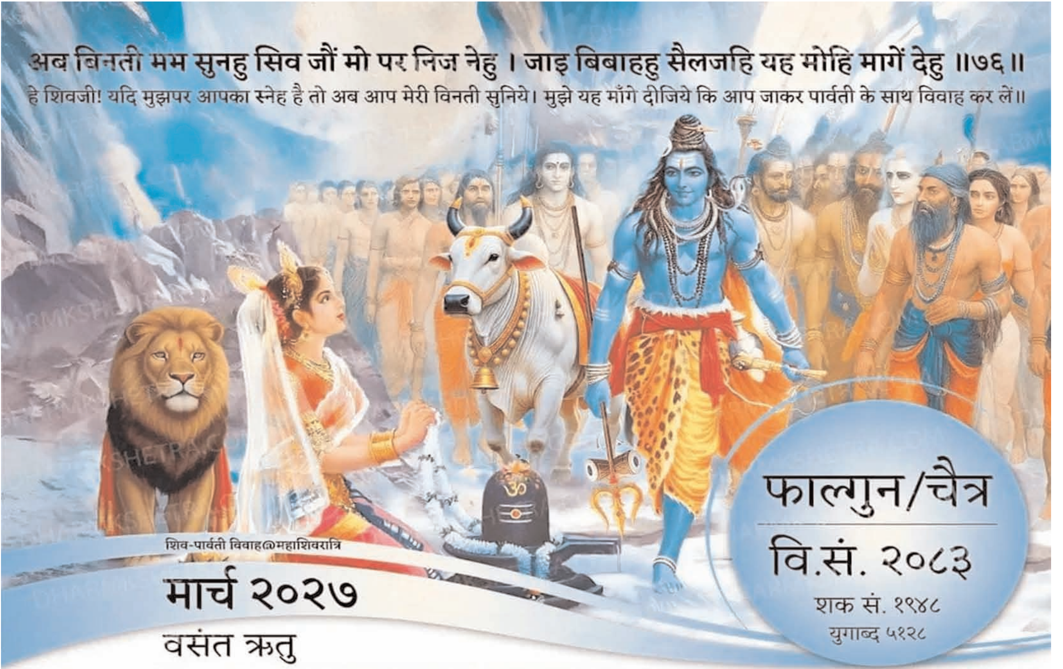
शिव-पार्वती विवाह @ महाशिवरात्रि

अब विनती मम सुनहु सिव जौं मो पर निज नेहु । जाइ बिबाहहु सैलजहि यह मोहि मागें देहु ॥७६॥ हे शिवजी! यदि मुझपर आपका स्नेह है तो अब आप मेरी विनती सुनिये। मुझे यह माँगे दीजिये कि आप जाकर पार्वती के साथ विवाह कर लें॥