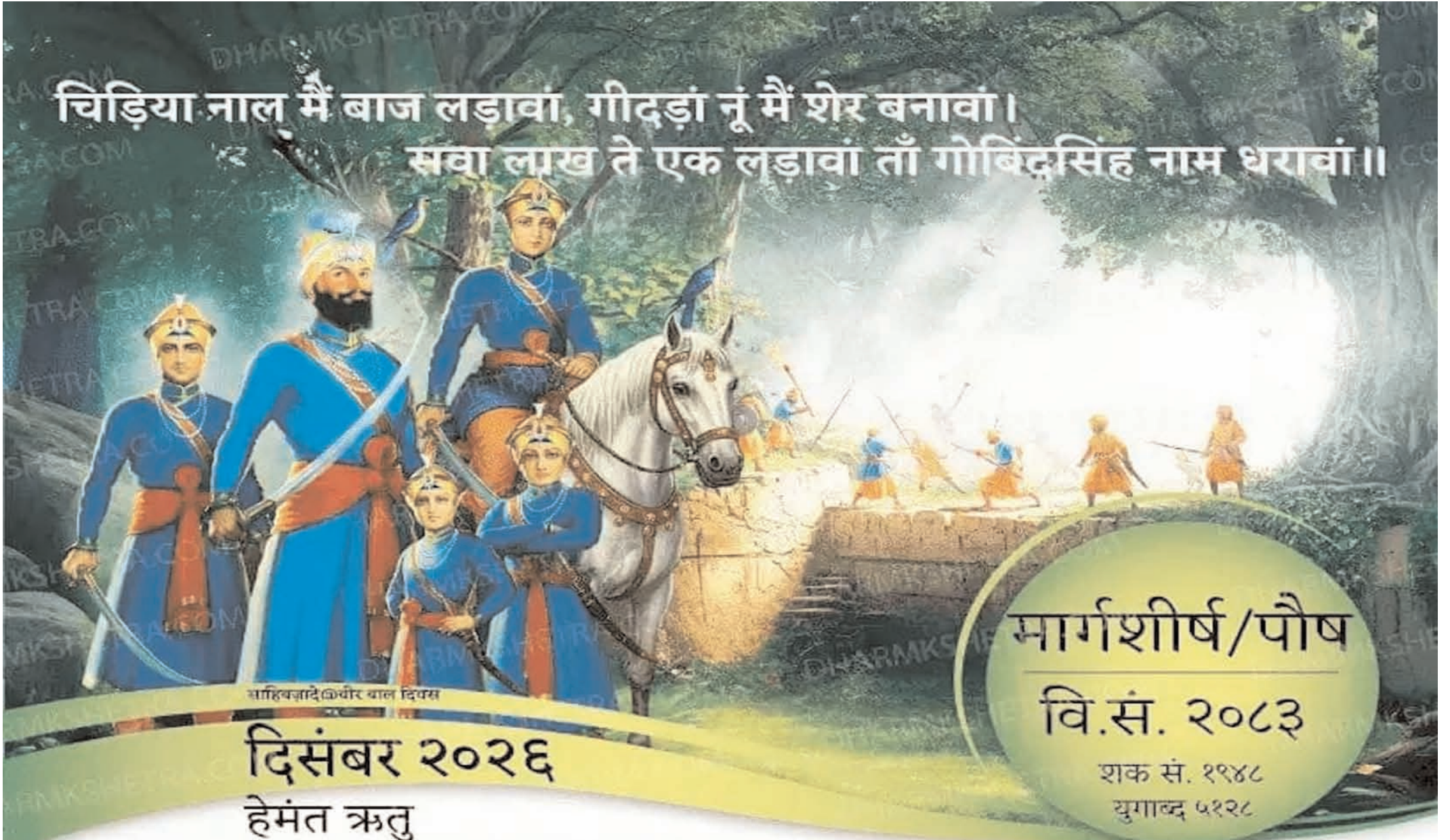
साहिबजादे (विचर बाल दिपस)

चिड़िया जाल में बाज लड़ावां, गीदड़ां नूं में शेर बनावां। सवा लाख ते एक लड़ावां तां गोबिंदसिंह नाम धरावां।।