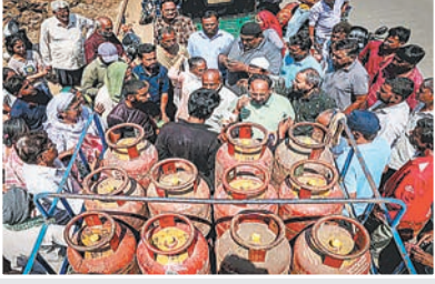
ब्रह्मास्त्र ► नई दिल्ली

पश्चिम एशिया में चल रहे भारी तनाव के बीच भारत में गैस की किल्लत को लेकर मचा हाहाकार अब थमने लगा है। बीते दिनों जंग के हालातों के बीच कमर्शियल सिलेंडरों की आपूर्ति रोके जाने से देश भर में भारी अफरातफरी मच गई थी। लेकिन अब सरकार ने इस संकट से निपटने के लिए बड़ा कदम उठाया है।