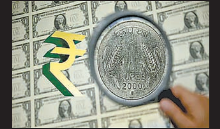
ब्रह्मास्त्र ► नई दिल्ली

जानिए क्यों अमेरिकी डॉलर के मुकाबले रुपया 92.40 के रिकॉर्ड निचले स्तर पर पहुंच गया। कच्चे तेल की कीमतों, विदेशी फंड की निकासी और होमजुज जलडमरूमध्य के खुलने की उम्मीदों का भारतीय मुद्रा पर असर समझें। विस्तृत रिपोर्ट अभी पढ़ें। भू-राजनीतिक अनिश्चितताओं और वैश्विक ऊर्जा बाजार में जारी उथल-पुथल का सीधा असर भारतीय मुद्रा पर देखने को मिला है। सोमवार को अमेरिकी डॉलर के मुकाबले रुपया 10 पैसे कमजोर होकर 92.40 (अस्थायी) के नए सर्वकालिक निचले स्तर पर बंद हुआ। कच्चे तेल की कीमतों में भारी उछाल और विदेशी निवेशकों द्वारा लगातार की जा रही फंड निकासी ने रुपये पर यह भारी दबाव बनाया है। यह स्थिति मुद्रा बाजार में बढ़ती अस्थिरता और वैश्विक व्यापारिक चिंताओं को स्पष्ट रूप से दर्शाती है। मुद्रा बाजार के ताजा आंकड़ों के अनुसार, सोमवार के कारोबारी सत्र में रुपये ने ऐतिहासिक गोता लगाया। अंतरबैंक विदेशी मुद्रा विनिमय बाजार में स्थानीय मुद्रा की शुरुआत ही कमजोरी के साथ 92.44 के स्तर पर हुई। दिन के कारोबार के दौरान, डॉलर के मुकाबले रुपये ने 92.47 के अपने अब तक के सबसे निचले स्तर को छु लिया। कारोबारी सत्र के अंत में, रुपया अपने पिछले बंद भाव से 10 पैसे का नुकसान दर्ज करते हुए 92.40 (अस्थायी) पर बंद हुआ। रुपये की इस ऐतिहासिक गिरावट के पीछे मुख्य रूप से दो बड़े अंतरराष्ट्रीय कारक काम कर रहे हैं: कच्चे तेल की कीमतों में उछाल: वैश्विक बाजार में कच्चे तेल की कीमतों में लगातार वृद्धि हो रही है, जिससे भारत का आयात बिल प्रभावित होने की आशंका है और डॉलर की मांग में भारी इजाफा हुआ है।