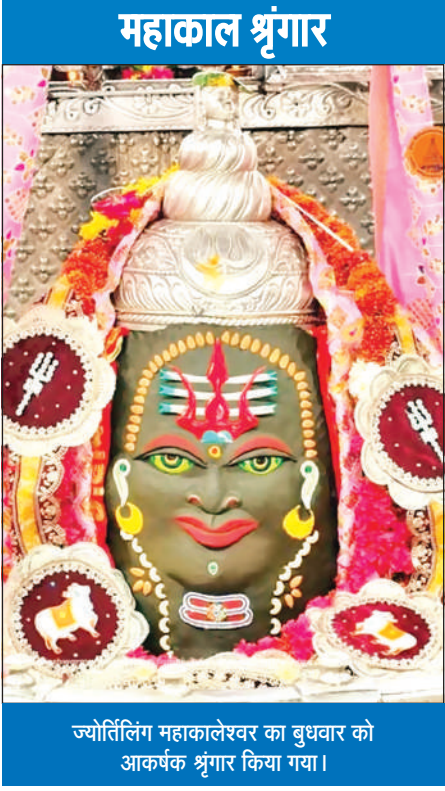
ज्योतिर्लिंग महाकालेश्वर का बुधवार को आकर्षक श्रृंगार किया गया।