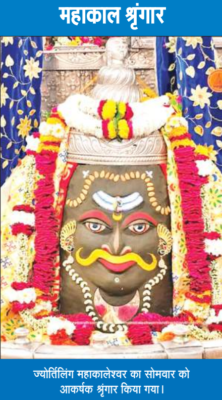
ज्योतिर्लिंग महाकालेश्वर का सोमवार को आकर्षक श्रृंगार किया गया।