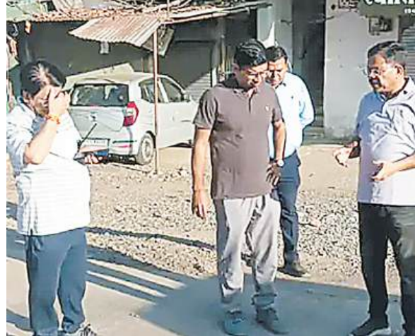
कर्मचारियों की सैलरी काटो, लापरवाही बर्दाश्त नहीं- गंदगी देख निगम कमिश्नर नाराज हो गए। उन्होंने संबंधित जॉन के तीनों सीटीपीटी सुपरवाइजरों की एक-एक दिन की सैलरी काटने को कहा। उन्होंने स्पष्ट किया है कि सार्वजनिक शौचालयों में स्वच्छता बनाए रखना बेहद जरूरी है और इसमें किसी भी प्रकार की लापरवाही को बर्दाश्त नहीं करेंगे।