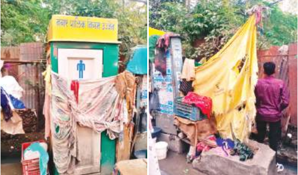
दैनिक अवन्तिका ▶▶ उज्जैन