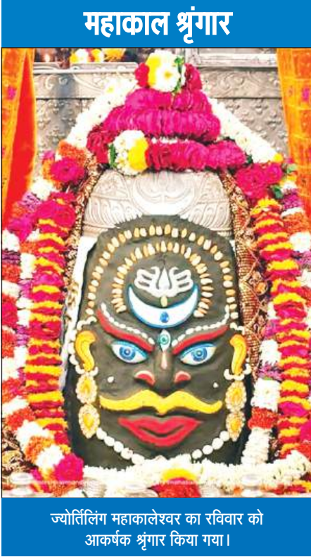
ज्योतिर्लिंग महाकालेश्वर का रविवार को आकर्षक श्रृंगार किया गया।