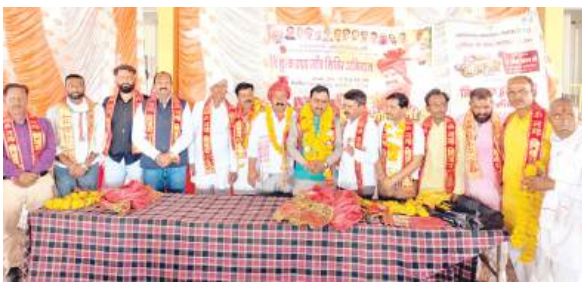
दैनिक अवन्तिका ▶▶ उज्जैन

25 मार्च को मुख्यमंत्री डॉ. यादव करेंगे समापन; अपने जन्मदिन पर लाभार्थियों के बीच रहेंगे मौजूद