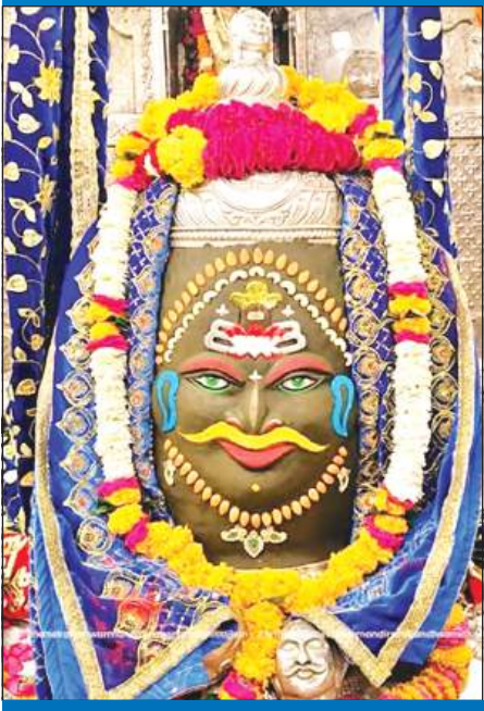
ज्योतिर्लिंग महाकालेश्वर का शनिवार को आकर्षक श्रृंगार किया गया।