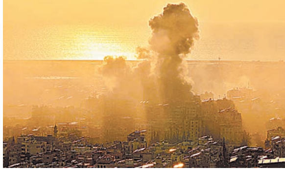
यहां इजराइल का बड़ा न्यूक्लियर प्लांट है। ईरान की ओर से यह हमले ट्रम्प की धमकी के बाद बढ़े हैं।

ईरान ने इजराइल पर रविवार सुबह से 4 बैलिस्टिक मिसाइलें दागीं। टाइम्स ऑफ इजराइल के मुताबिक, इन हमलों में 300 से ज्यादा लोग घायल हुए हैं। इजराइली विदेश मंत्रालय और स्वास्थ्य सेवाओं के अनुसार, घायलों में बच्चे भी शामिल हैं। इससे पहले ईरान ने शनिवार रात भी इजराइल के डिमोना और अराद शहरों पर हमला किया था।