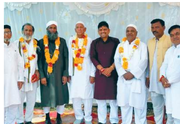
दैनिक अवन्तिका ▶▶ कानड़

ईद-उल-फितर के मौके पर शनिवार को शिव पहाड़ी स्थित ईदगाह पर मुस्लिम समाज ने मिलकर ईद की नमाज अदा की। सभी लोगों ने नमाज अदा करने के बाद एक-दूसरे से गले मिलकर ईद की मुबारकबाद दी। स्थानीय लोगों ने बातचीत में बताया कि एक महीने के रोजे रखने के बाद ईद का दिन आता है, इसलिए इसका इंतजार हर किसी को रहता है। ये दिन अल्लाह की तरफ से एक खास इनाम होता है। पूरे महीने सब, इबादत और खुदा की बंदगी करने के बाद ये खुशी का दिन नसीब होता है। यही वजह है कि लोग इसे बहुत प्यार और इज्जत के साथ मनाते हैं।