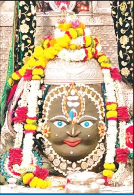
ज्योतिर्लिंग महाकालेश्वर का श्रृंगार को आकर्षक श्रृंगार किया गया।