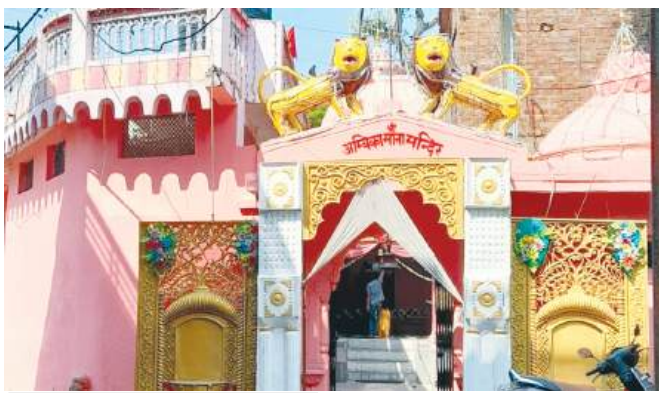
मंदिर की विशेषता

ऐसी मान्यता है कि मंदिर में जो प्रतिमा है वह खुदाई में मिली थी। जो लगभग साढ़े तीन सौ वर्ष पुरानी है। लगभग ढाई से 3 फीट ऊंची यह प्रतिमा काले पाषण की बनी हुई है। मंदिर के गर्भगृह के पीछे अंजनी लाल की मूर्ति है, आगे गुणेश्वर महादेव व मुख्य द्वार पर सती माता का चित्र पत्थर पर उकेरा हुआ है।