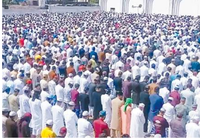
दैनिक अवन्तिका ▶ देवास

देवास में शनिवार को ईद-उल-फितर का पर्व उत्साह और भाईचारे के साथ मनाया गया, जहां मुस्लिम समाज के लोगों ने सुबह मस्जिदों में नमाज अदा की, नमाज के बाद अमन-चैन और शांति की दुआ मांगी और एक-दूसरे को गले लगाकर ईद की मुबारकबाद दी, वहीं शहर की मुस्लिम बस्तियों में सुबह से ही चहल-पहल देखने को मिली।