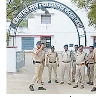
अफवाह माना जा रहा है। मामले की गंभीरता को देखते हुए प्रधान जिला एवं

एमपी के सतना जिले के अंतर्गत आने वाले सतना और मैहर जिला न्यायालय में शुक्रवार की सुबह उस समय हड़कंप मच गया, जब ये न्यायालय की आधिकारिक मेल आईडी पर एक धमकी भरा मेल रिसीव हुआ। ये मेल कोई ऐसी-वैसी धमकी से जुड़ा नहीं था, बल्कि इस मेल के जरिए जिला कोर्ट परिसर को बम से उड़ाने की धमकी दी गई है।