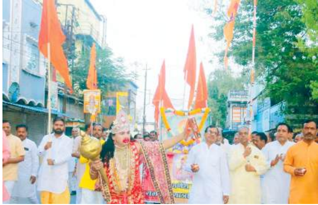
दैनिक अवन्तिका ▶▶ शुजालपुर