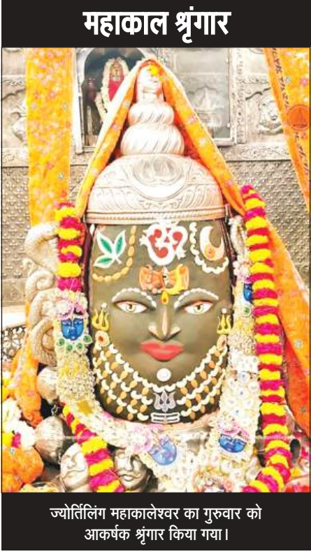
ज्योतिर्लिंग महाकालेश्वर का गुरवार को आकर्षक श्रृंगार किया गया।

इस वर्ष 21 मार्च को सूर्य विषुवत रेखा पर लम्बवत रहेगा