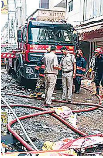
बेसमेंट, ग्राउंड और फर्स्ट फ्लोर पर कपड़े और कॉस्मेटिक सामान के स्टोरेज के लिए किया जा रहा था। सेकेंड और थर्ड

पीएम ने मृतकों के परिजनों को 2 लाख मुआवजे का ऐलान किया