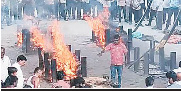
मुक्तिधाम में एक साथ 7 चिताएं जलीं