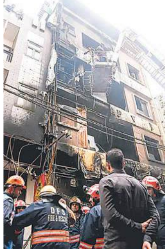
शव बरामद किए जा चुके हैं। मृतकों की संख्या बढ़ने की आशंका है। न्यूज एजेंसी आईएनएस के मुताबिक, बिल्डिंग के

दोनों को गंभीर चोटें आई हैं। दिल्ली फायर सर्विस के कर्मियों ने 10 लोगों का रेक्स्यू किया। इनमें 3 लोग घायल हैं। करीब 30 फायर ब्रिगेड मौके पर मौजूद हैं। आग पर काबू पा लिया गया है। फिलहाल आग लगने के कारणों का पता नहीं चल पाया है। स्थानीय लोगों के अनुसार, आग शॉर्ट सर्किट के कारण लगी और तेजी से फैल गई। इमारत में उस समय 10-15 लोग मौजूद थे। इनमें कुछ