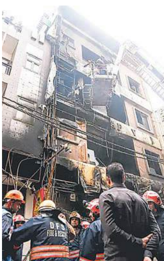
शव बरामद किए जा चुके हैं। मृतकों की संख्या बढ़ने की आशंका है। न्यूज एजेंसी आईएनएस के मुताबिक, बिल्डिंग के

दिल्ली के पालम स्थित साध नगर में एक रिहायशी 4 मंजिला बिल्डिंग में बुधवार सुबह करीब 7 बजे भीषण आग लग गई। हादसे में 9 लोगों की मौत हो गई, जिनमें 3 नाबालिग लड़कियां शामिल हैं। 2 लोगों ने जान बचाने के लिए बिल्डिंग से छलांग लगा दी। दोनों को गंभीर चोटें आई हैं। दिल्ली फायर सर्विस के कर्मियों ने 10 लोगों का रेक्स्यू किया। इनमें 3 लोग घायल हैं। करीब 30 फायर ब्रिगेड मौके पर मौजूद हैं। आग पर काबू पा लिया गया है। फिलहाल आग लगने के कारणों का पता नहीं चल पाया है। स्थानीय लोगों के अनुसार, आग शॉर्ट सर्किट के कारण लगी और तेजी से फैल गई। इमारत में उस समय 10-15 लोग मौजूद थे। इनमें कुछ