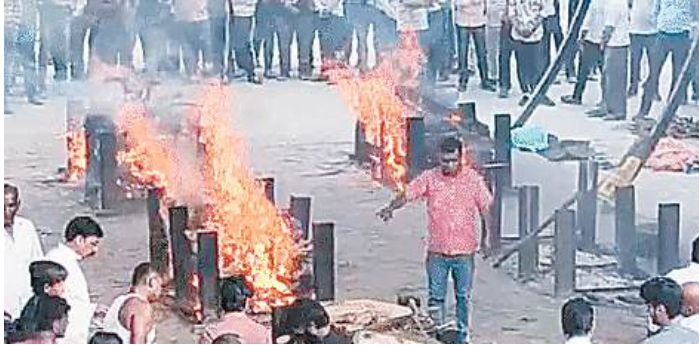
मुक्तिधाम में एक साथ 7 चिताएं जलीं