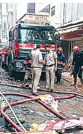
बेसमेंट, ग्राउंड और फर्स्ट फ्लोर पर कपड़े और कॉस्मेटिक सामान के स्टोरेज के लिए किया जा रहा था। सेकेंड और थर्ड

पीएम ने मृतकों के परिजनों को 2 लाख मुआवजे का ऐलान किया