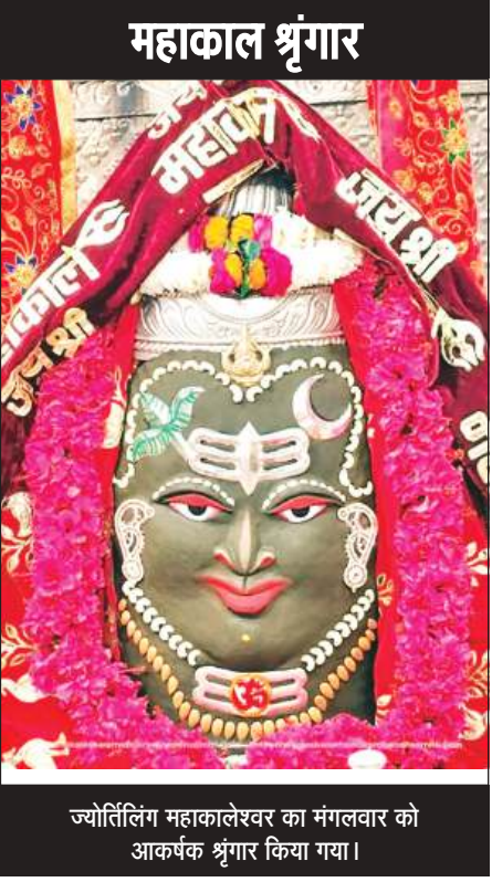
ज्योतिर्लिंग महाकालेश्वर का मंगलवार को आकर्षक श्रृंगार किया गया।