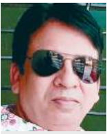
संजय वर्मा दैनिक अवन्तिका

निखर जाती है बेटे के हाथों की सुन्दरता में चार-चाँद लगती जाए जब लगी हो हाथों में मेहंदी। मेहंदी,रोसा और बेटा लगती जैसे बहन हो आपस में महकती जाए निखरती जाए जब लगी हो हाथों में मेहंदी। मेहंदी भी जाती है बेटे के संग ससुराल में बाबुल की यादों के आंसू कैसे पोछे जब लगी हो हाथों में मेहंदी। जब न होगी बेटियाँ तो किसे लगायेगे मेहंदी होगी बेटियाँ तब ज्यादा ही रचेगी जब लगी हो हाथों में मेहंदी।