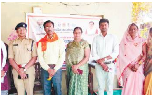
शुजालपुर में आपदा प्रबंधन प्रशिक्षण कार्यक्रम सम्पन्न