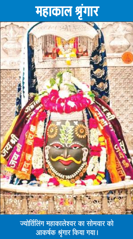
ज्योतिर्लिंग महाकालेश्वर का सोमवार को आकर्षक श्रृंगार किया गया।