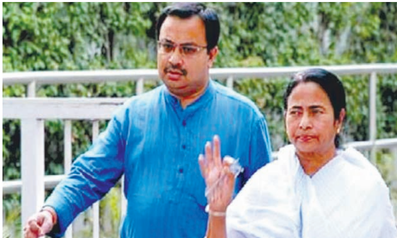
ब्रह्मास्त्र ►► कोलकाता