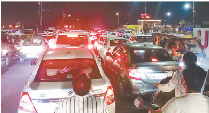
हरी फाटक पर लगा जाम 1 घंटे की मशक्कत के बाद खुला

आगे आए और 1 घंटे की मशक्कत के बाद यहाँ की यातायात व्यवस्था सुधरी और जाम में फंसे वाहनों को एक-एक कर निकाला गया। बताया जाता है की छुट्टी के दिन वाहनों के आने वाले लोगों की संख्या बढ़ जाती है और ऐसी स्थिति में महाकाल की तरफ जाने वाले सभी मार्गों