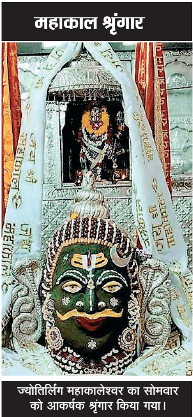
ज्योतिर्लिंग महाकालेश्वर का सोमवार को आकर्षक श्रृंगार किया गया।