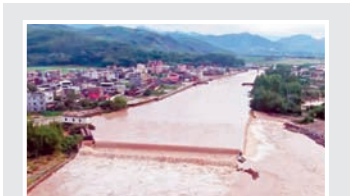
चीन में भारी बारिश और बाढ़ की चेतावनी, 44 नदियां खतरे के निशान से ऊपर, 1 हजार से ज्यादा स्कूल बंद, 11 लापता और 6 घायल।

श्रीनगर। राष्ट्रीय जांच एजेंसी (एनआईए) सोमवार को जम्मू-कश्मीर के श्रीनगर में कई स्थानों पर छापेमारी कर रही है। सूत्रों के मुताबिक केन्द्रीय एजेंसी आतंकवादियों के पाक कनेक्शन का पता लगाने के लिए छापेमारी कर रही है। सूत्रों ने बताया कि एजेंसी को सूचना मिली है कि आतंकवादियों को पाक से धन प्राप्त हो रहा है। एजेंसी उसी कनेक्शन का पता लगाने का प्रयास कर रही है। इस संबंध में एक सरकारी अधिकारी का भी नाम सामने आया है। एजेंसी उसके ठिकानों पर भी तलाशी ले रही है। गौरतलब है कि आतंकवादियों को पाकिस्तान से धन प्राप्त होने की सूचना पहले भी मिलती रही है। मामले में कई लोगों को गिरफ्तार भी किया जा चुका है।