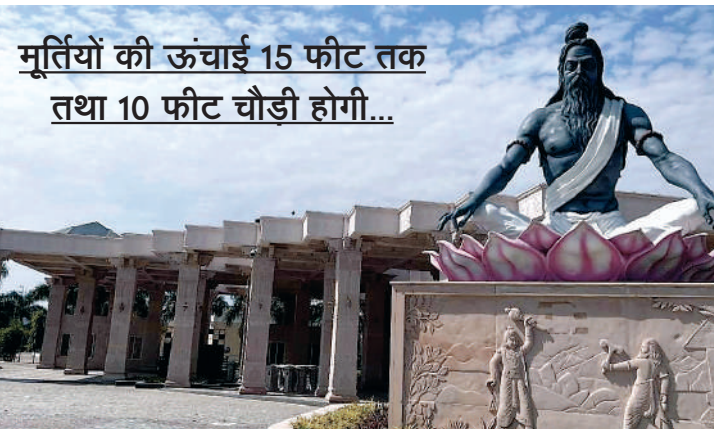
मूर्तियों की ऊंचाई 15 फीट तक तथा 10 फीट चौड़ी होगी...

अभी वर्तमान में महाकाल लोक के अंदर एफआरपी फाइबर रिइन्फोर्स प्लास्टिक की मूर्तियां लगी हैं। लेकिन अब ओडिशा के कलाकार पत्थरों से नई मूर्तियां तराश रहे हैं। यह 6 महीने में बनकर तैयार होगी। इसके बाद एक-एक कर मूर्तियां बदली जाएंगी। पुरानी मूर्तियों को मंदिर क्षेत्र के ही चौराहों पर लगाने का प्लान है।